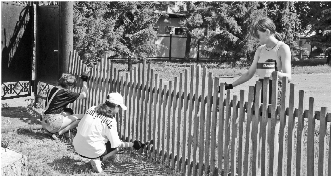
➤ Покраска забора в с. Викулово