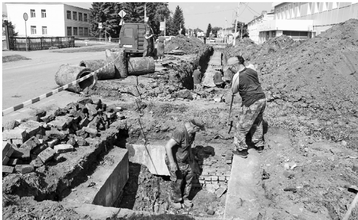
Идёт замена теплотрассы