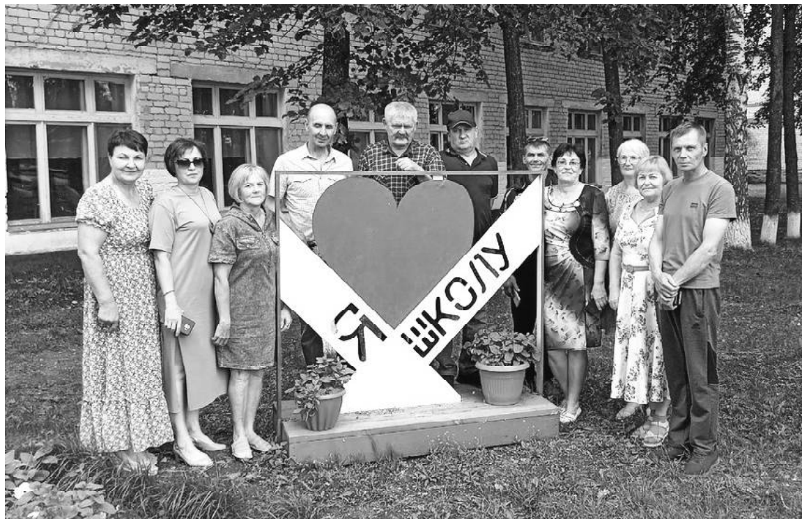
➤ Выпускники Поддубровинской школы, 1983 г.

Наш огромный 5 класс, 42 человека, был беспокойным и шумным, доставлявший немало хлопот нашим учителям, которые терпеливо и настойчиво помогали нам постигать знания. С тех пор прошло немало лет, а мы для них по-прежнему остаёмся учениками.