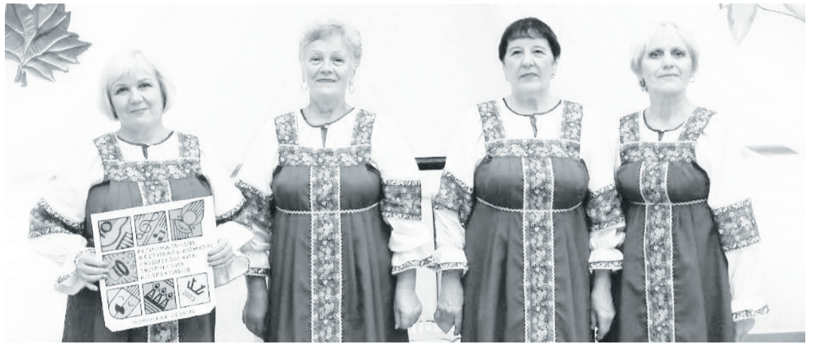
Вокальная группа «Ивушки» Емуртлинского СДК на региональном фестивале творческих коллективов.