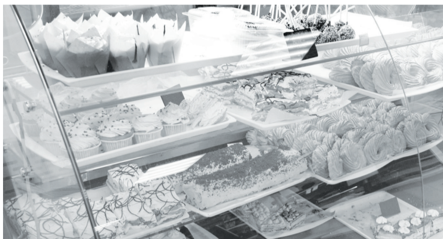
Сладкоежкам предлагают большой ассортимент кондитерских изделий.