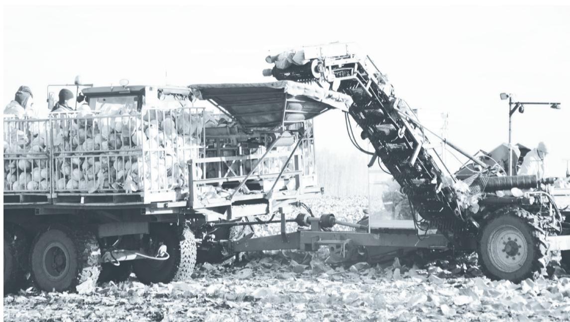
Несмотря на применение спецтехники, темпы уборки капусты во многом зависят от слаженных действий овощеводов.

Информация предоставлена администрацией Упоровского района.