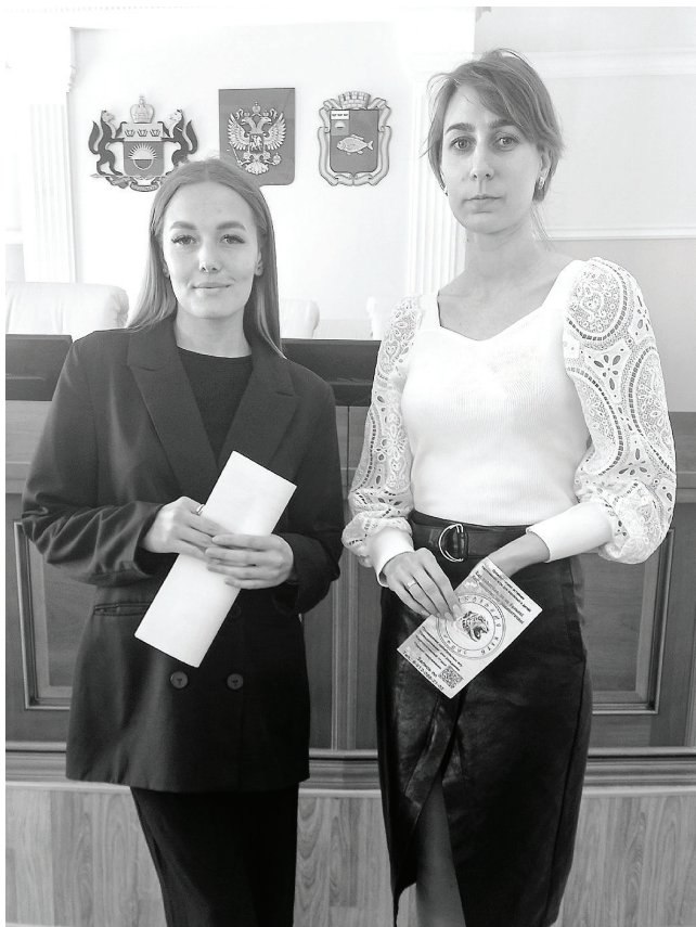
В 1,5 раза – до 122,3 тыс. – увеличилось количество самозанятых в Тюменской области за год. А численность занятых в сфере малого и среднего предпринимательства выросла до 230,2 тыс. человек, приводит данные ФНС России региональный департамент экономики.

В прошлом году по программе в районе было реализовано 11 проектов, шесть на территории города. Как отмечают специалисты, поддержка пользуется популярностью у клиентов ЦЗ, однако для ее получения необходимо соблюсти ряд условий – на момент подачи заявления гражданин должен быть признан безработным и