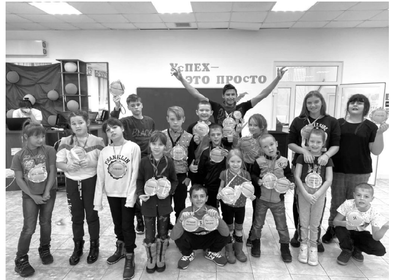
» «Ступени лидерства» в «Русичах»