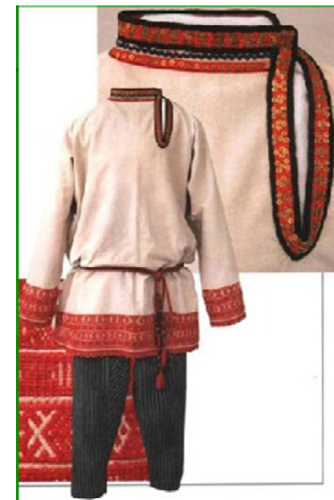
А. ПАЙВИНА