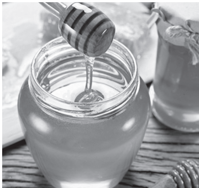
Мёд – не просто подсластитель, это ценный пищевой продукт, который способен укрепить наше здоровье.

• Другой способ для обнаружения сахара – разогреть с помощью зажималки кончик железной проволоки (например, выпрямив скрепку) и затем опустить её в мёд