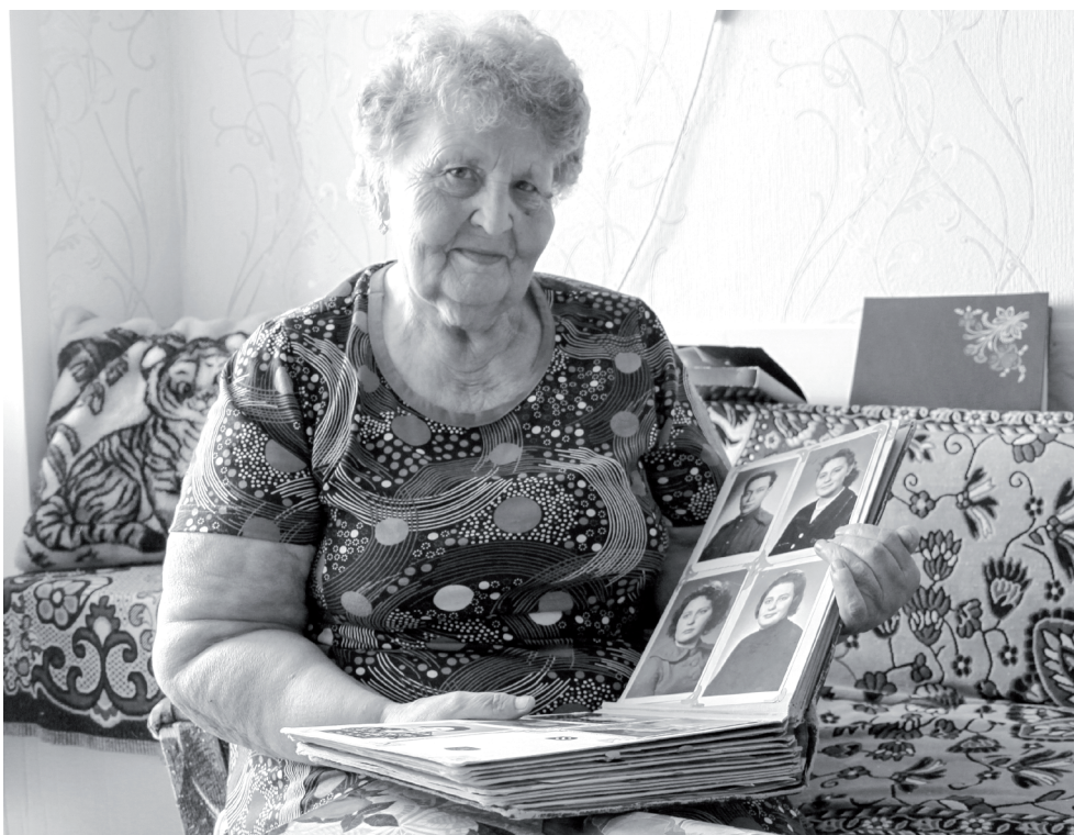
Семейный альбом надёжно хранит и образы любимых людей, и воспоминания.