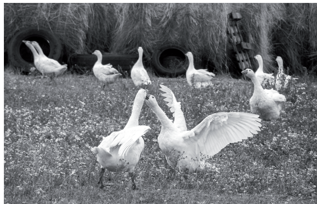
На подворье Жапаровых имеется много различной живности, дающей постоянный и стабильный доход.

Пока ЛПХ Жапарова набирает обороты, наращивает клиентскую базу, наращивает поголовье. О большой прибыли речи ещё не ведётся, деньги вкладываются в развитие, но на жизнь Кайрату и Розе вполне хватает. К тому же на столе у них всегда свежие экологически чистые продукты. А это тоже немаловажно.