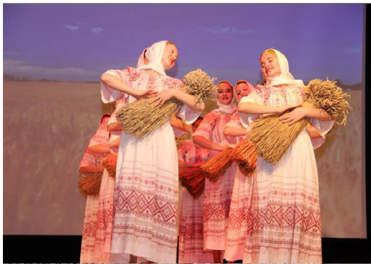
➤ Гостей приветствует танцевальный ансамбль «Фиеста».