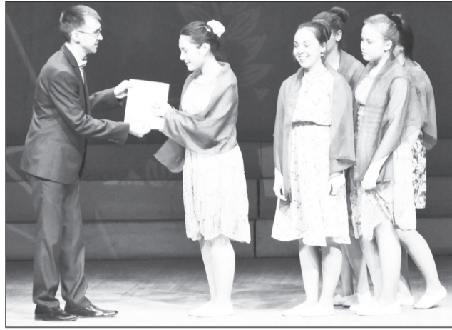
Танцевальный коллектив «Весёлые праздники» Ингалинского СДК получает заслуженный диплом.