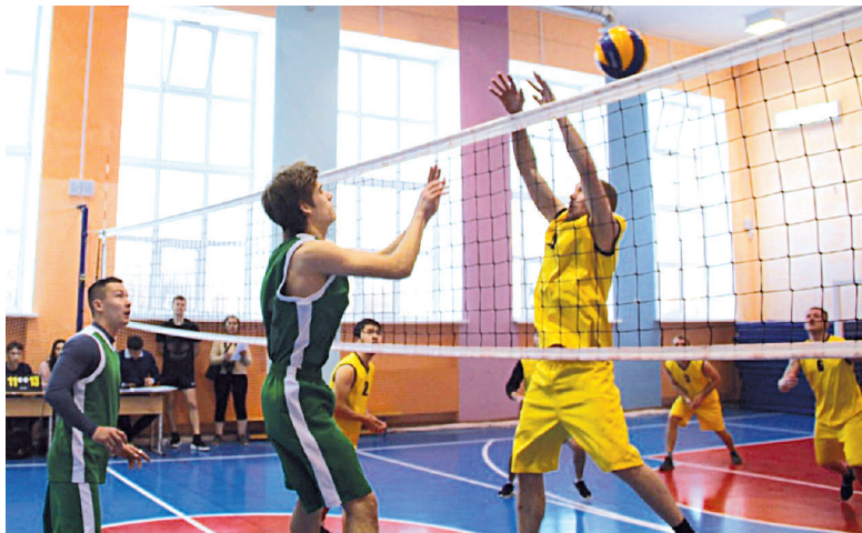
Стартовал чемпионат по волейболу

Спор за мяч. В Малозоркальцево проходил первый тур чемпионата Тобольского района по волейболу среди мужских и женских команд. В спор за мяч вступили восемь женских и пять мужских команд. Игры проходили в напряжённой борьбе, порой до последних минут не было ясно, кто же победит. Команды отыгрывались, отставая на 5-7 очков под конец партии. Упорная борьба, но без досадных поражений, желание победить, игровой опыт и удача привели к следующим итогам. Абалакские волейболистки обыграли представительниц Булашово со счётом 2:1. Ворогушинские спортсменки взяли верх над соперницами из Кутарбитки и потерпели поражение во встрече с сетовцами. В активе спортсменок из Сетово ещё одна победа над командой из