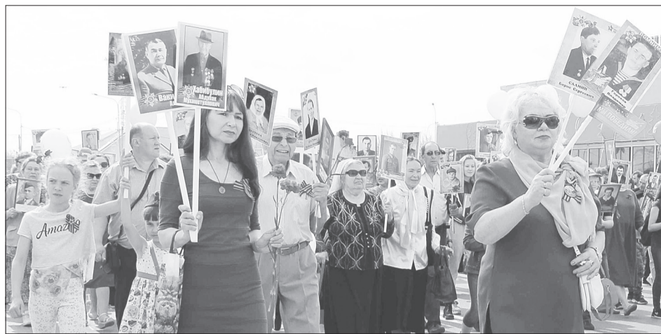
Бессмертный полк каждый раз собирает всё больше ялуторовчан (фото 2019 года)

С 11 до 14 часов в городском саду развернётся интерактивная программа «Рио-Рита - радость Победы», в рамках которой прозвучат во-