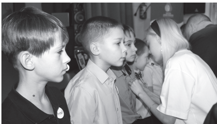
Юные активисты РДШ – отряд «Орлята России»