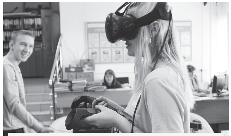
Дополнительное образование в Центре «Лидер» получают 1059 человек. Чтобы увлечь детей, педагоги всё чаще используют новые технологии.

Какая ситуация сложилась на рынке труда на 1 января? Зарегистрировано 36 безработных граждан, на регистрационном учёте в поисках работы – 41 человек. Потребность работодателей в работниках – 346, в том числе: сфера строительства – 132 вакансии, сельское и лесное хозяйства – 28, образование – 30, торговля и ремонт автотранспор-