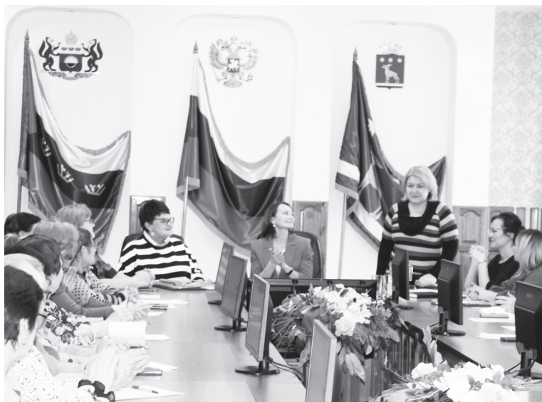
Участники разговора: активисты первичек, представители из Тюмени, ветераны из Армизона