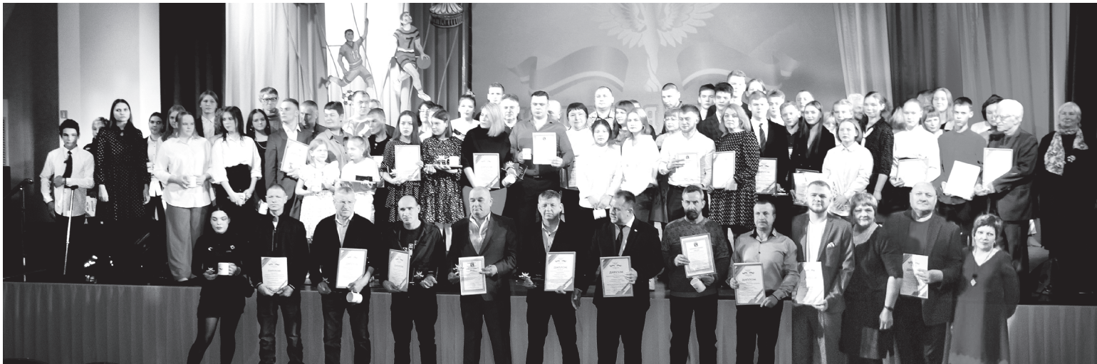
Ежегодно мероприятие собирает большое число юргинцев, среди которых не только спортсмены, но и организаторы физкультурного движения

Работа в команде требует слаженности и взаимопонимания, тогда победа точно сопутствует