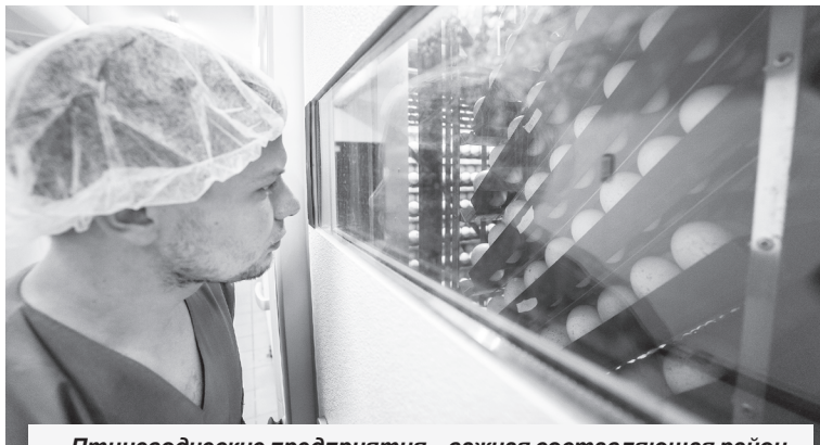
Птицеводческие предприятия – важная составляющая районного агрокомплекса. В ООО «РУСКОМ» за год произведено около 38 млн штук яиц. В ООО «Абсолют Агро» реализовано свыше 827 тыс. голов птицы за год.

Ольга КОНОВАЛОВА