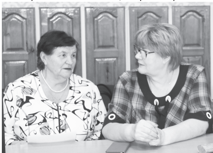
Семинар – возможность для общения единомышленников

снизить уровень правонарушений и антиобщественных действий среди несовершеннолетних – а это, как правило, школьники – и повысить родительскую ответственность за воспитание детей, помочь осознать, что они обязаны это делать. Таким образом, работа ведётся с двумя целевыми группами: семьями, испытывающими трудности в воспитании детей, и несовершеннолетними, состоящими на