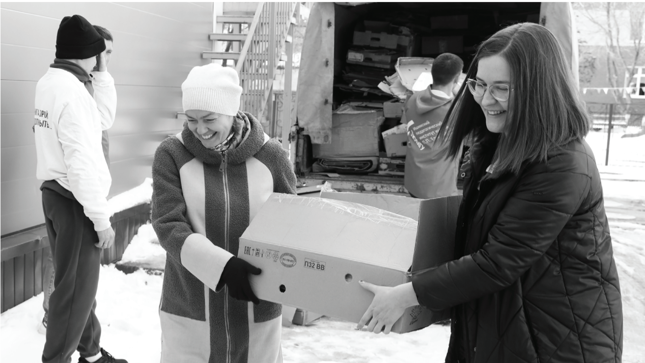
Акция по сбору макулатуры в поддержку национального проекта «Экология», который реализуется по решению президента России, стартовала 23 сентября.