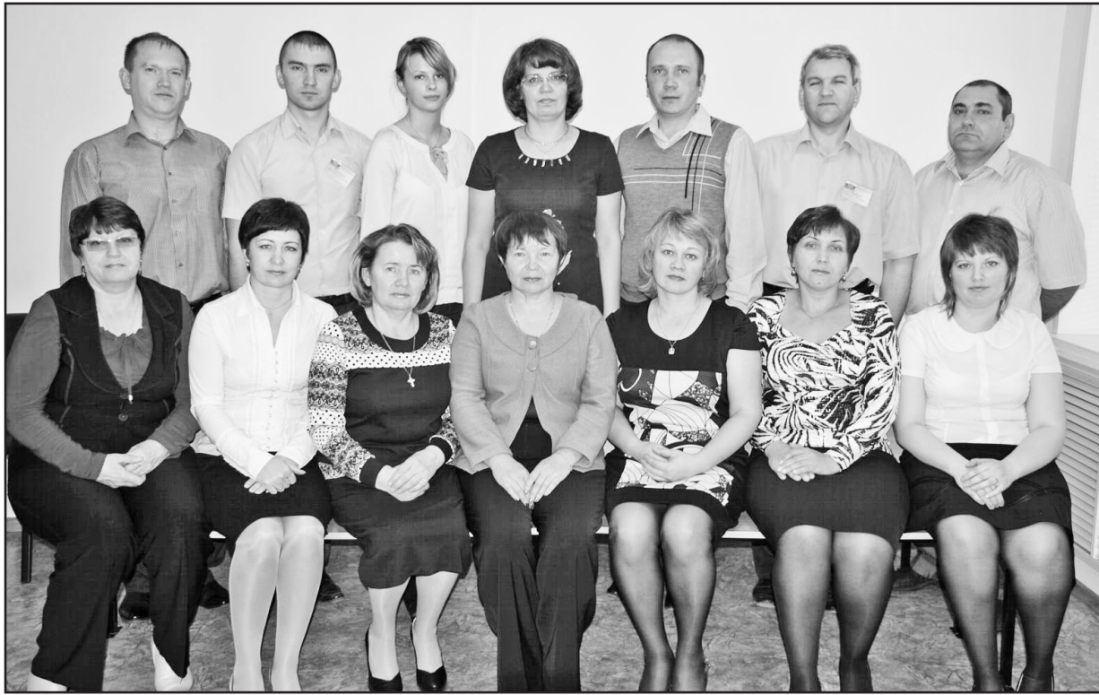
Коллектив Казанского районного суда. 2013 год