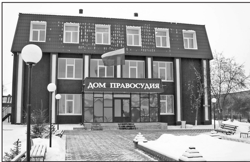
Одно из красивых и ухоженных зданий райцентра — Дом правосудия