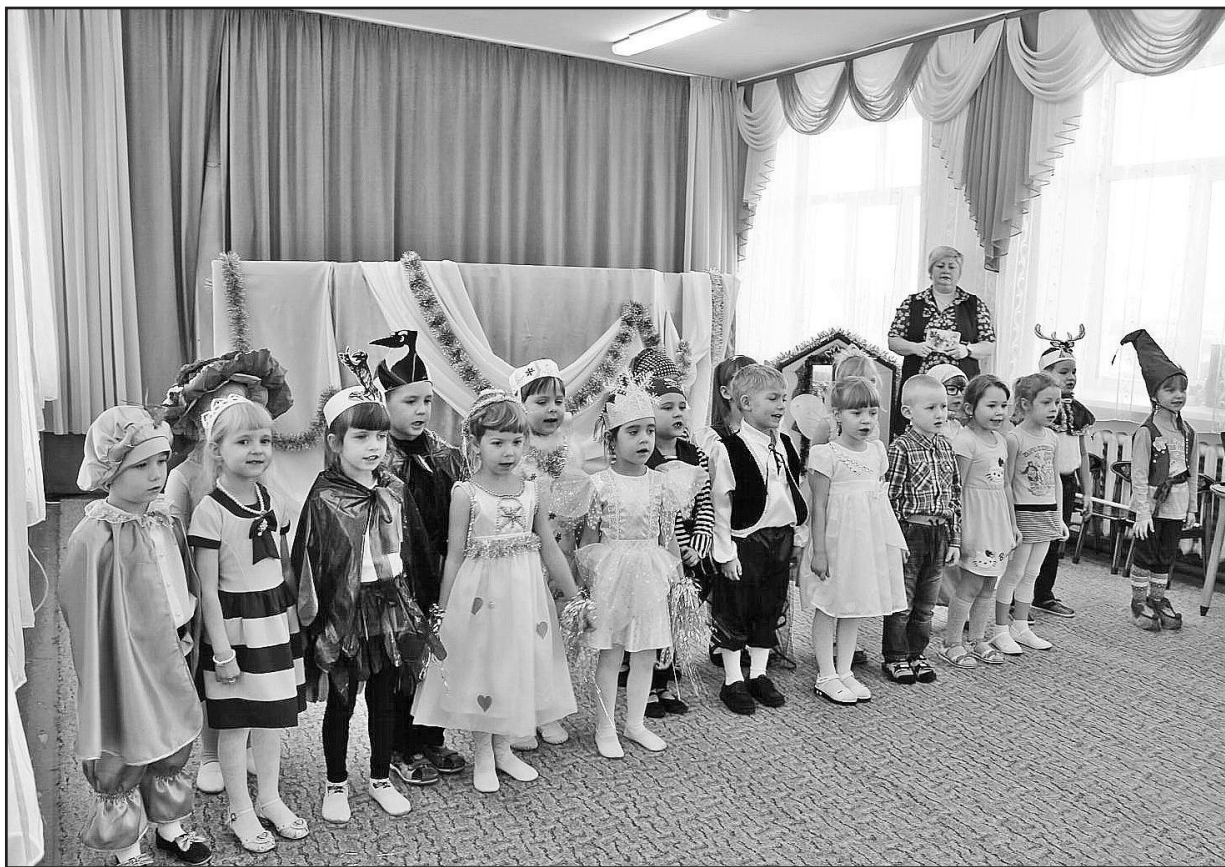
Юные артисты во время финальной сцены спектакля «Снежная королева»