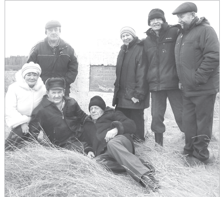
Сегодня луговские мальчишки и девчонки 60-х годов уже давно на заслуженном отдыхе