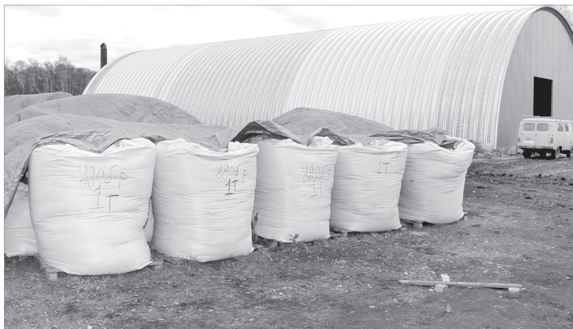
Компания тесно сотрудничает с самым инновационным сельхозпредприятием района - ОАО «Приозёрное», проводя эксперименты в растениеводстве и животноводстве

Полицейские научили первокурсников, как избежать влияния подобных пабликов. Напомнили ребятам и о сетевом этикете, так как за оскорбление в любой переписке предусмотрена административная ответственность.