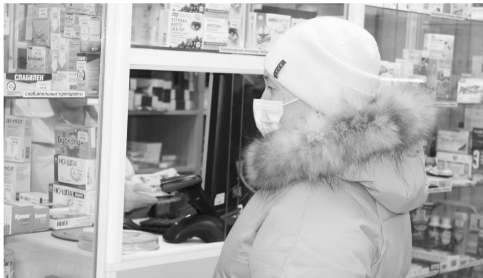
В период распространения вирусных инфекций в аптеках всегда есть покупатели. Необходимые препараты тоже имеются.

– Недавно были зарегистрированы противовирусные препараты, которые рекомендованы к использованию против COVID-19, такие, как арепливер, коронавир и подобные на основе фавипирави-