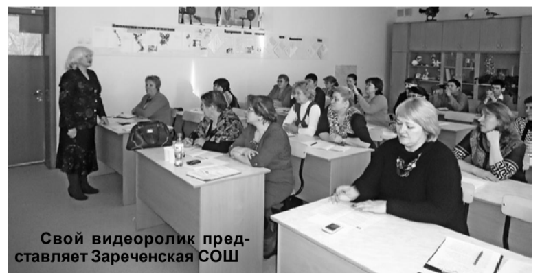
Свой видеоролик представляет Зареченская СОШ