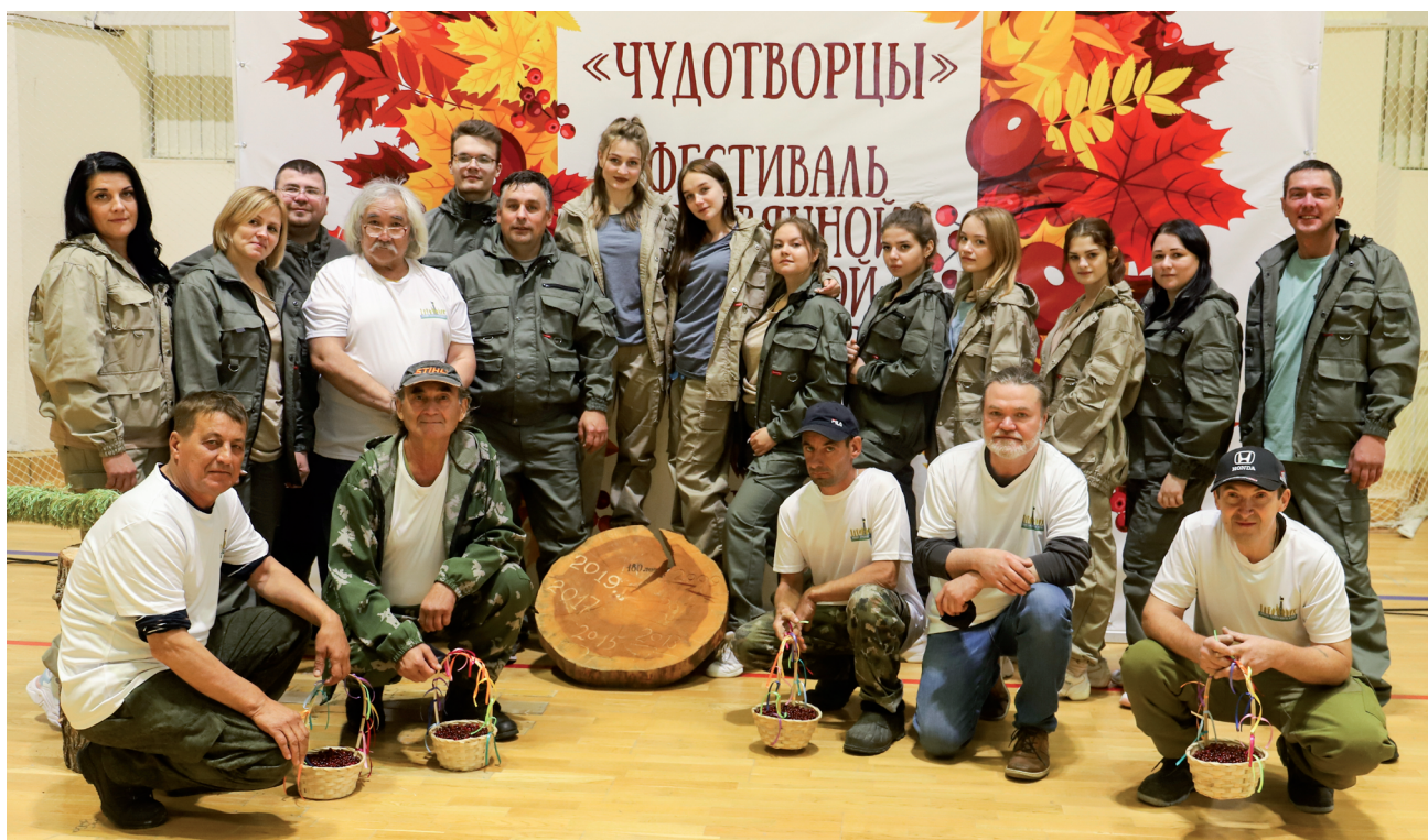
Участники открытия фестиваля парковой скульптуры «Чудотворцы».