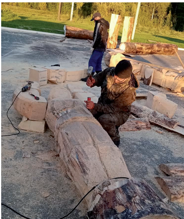
При помощи пилы, топора и стамески рождаются деревянные фигуры.

- Да, два года назад я ходил по площади с метлой, убирая опилки за мастерами. И даже не предполагал,