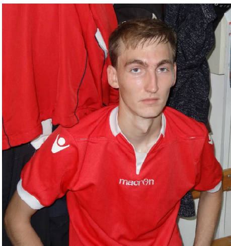
На прошлой неделе состоялись первые матчи плей-офф чемпионата Тюменской области по футболу среди взрослых команд (вторая лига,

южная зона). Викуловский «Спринт» принимал на своём поле Ишимскую команду «Стрехнино», занявшую в подгруппе «В» второе место.