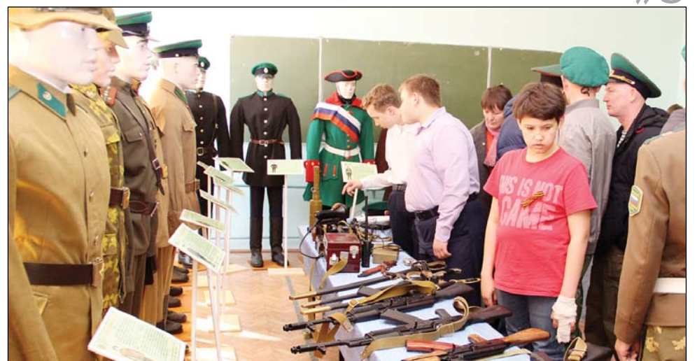
• Выставка пограничного обмундирования и вооружения в музейной комнате Дома детского творчества вызвала интерес не только у юного поколения.

ся, да и просто жить, пройдя армейскую школу, станут выглядеть точно так же. Ну, а сегодня этот митинг