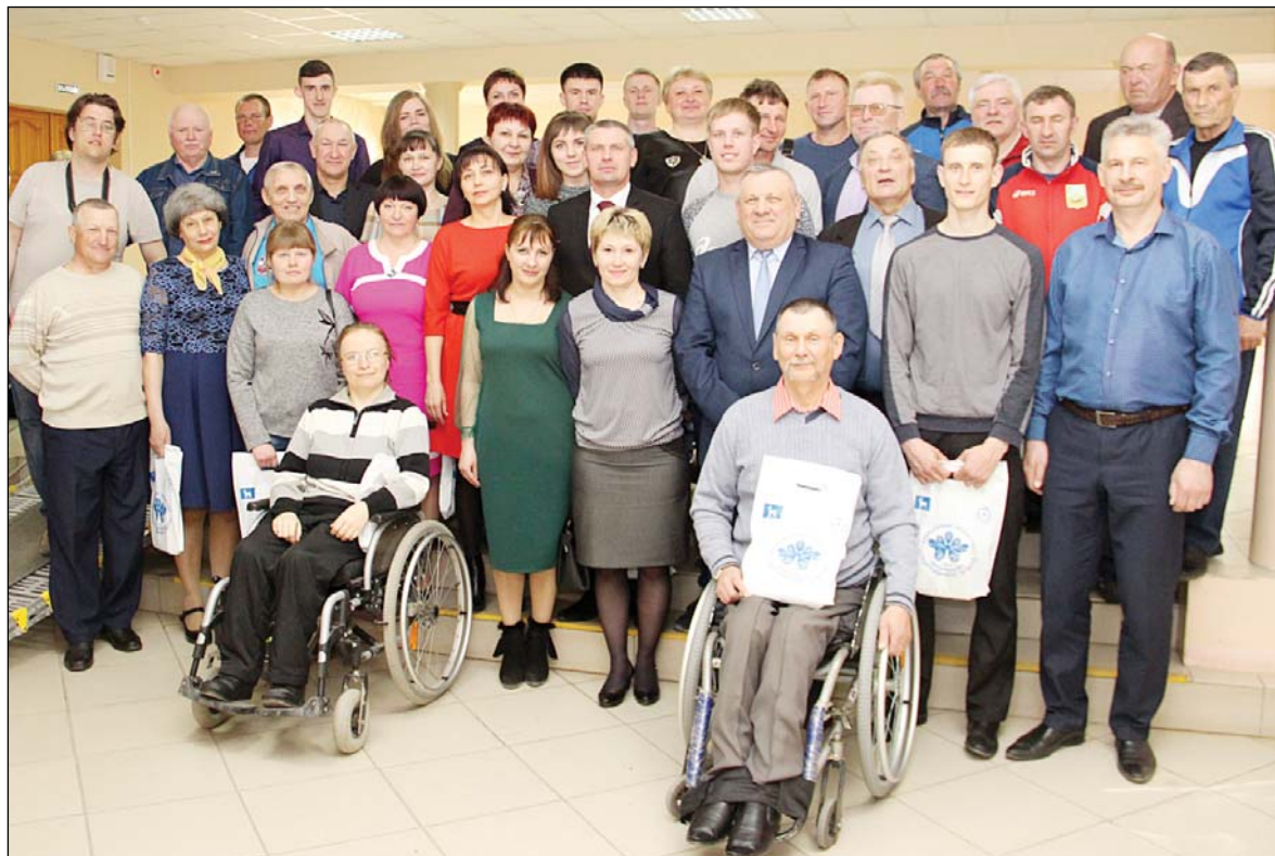
• Участники и призёры районного конкурса «Спортивная элита – 2018».

Полученные в этот день награды – это ещё не предел. Очередной успех – лишь первый шаг к следующему рубежу.