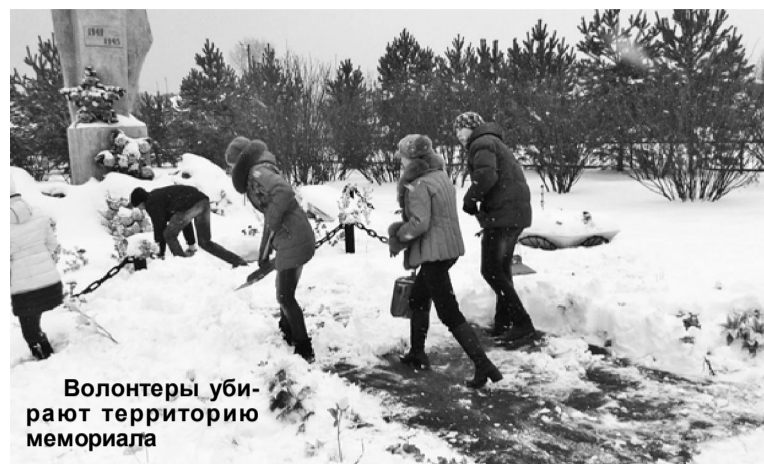
Волонтеры убирают территорию мемориала

На совместном заседании Президентского совета и совета волонтерского отряда утвержден план подготовки к празднованию 70-летия Великой Победы. Эта масштабная работа строится под девизом «70-летию Победы – 70 добрых дел». По отчетам исполнителей этой программы уже выполнено более двух десятков добрых дел. Назову лишь часть из них: акция «Поздравляем юбиляра» (ребята вручают поздравительные от-