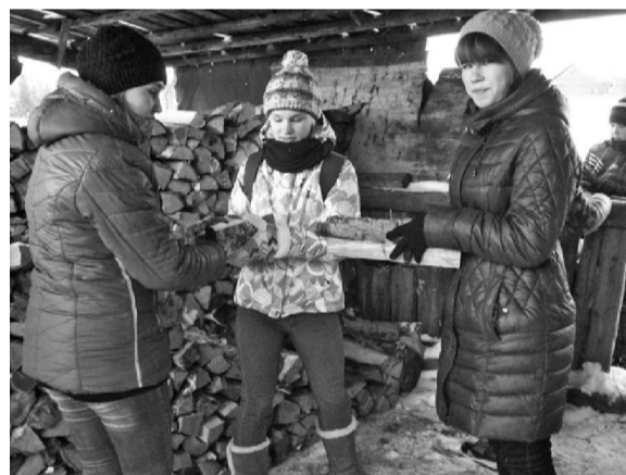
Участники акции «70-летию Победы - 70 добрых дел»

Пользуясь случаем, хочу выразить искреннюю благодарность нашим ветеранам за их неоценимый вклад в духовно-нравственное и гражданско-патриотическое воспитание наших детей. В свою очередь мы, педагоги школы, активно поддерживаем их инициативы и на-