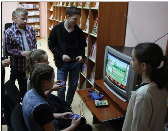
• Популярной комнатой вечера стала «Игротека в библиотеке».