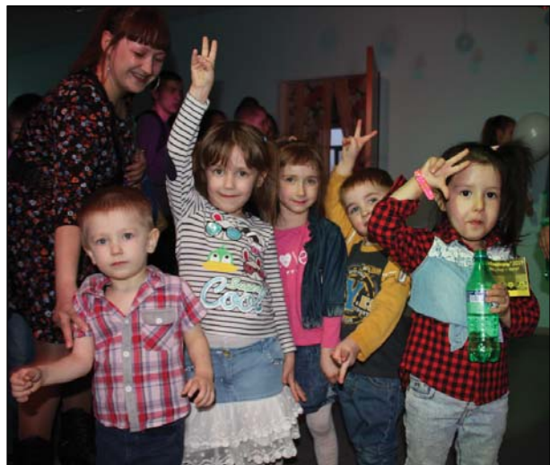
• Даже самые маленькие гости акции могли повеселиться, танцуя под хиты 90-х.

В комнате блиц-опроса команды с азартом собирали из карточек знаменитые для заданного тематикой времени фразы из литературных и музыкальных произведе-