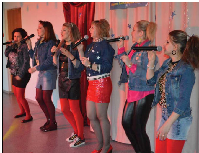
• Ритм на весь вечер своим зажигательным дебютным выступлением задавала группа «БиблиоМираж».