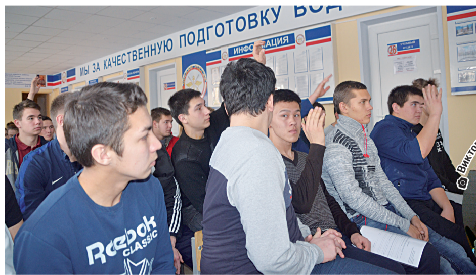
☉ На встречу пришли курсанты ДОСААФ и лицеисты

Эта дата почти совпала с днём выпуска взвода курсантов, обучающихся по специальности «Военный водитель». И они пришли на встречу полным составом – все 30 человек. Третий взвода – это курсанты из Тобольского района. Недавно, на передаче взвода военкоматом в ДОСААФ,