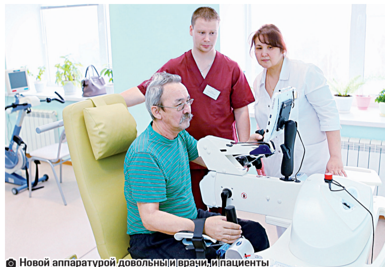
Новый аппаратом довольны и врачи, и пациенты

Тобольские врачи получили инновационное оборудование для реабилитации пациентов после церебрального инсульта