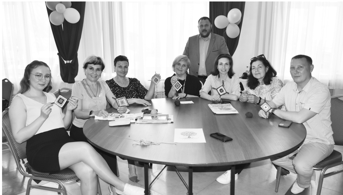
День для участников был плодотворным: знакомства, обучение, новые технологии

- Мы рады видеть всех в этом уютном зале. Ваши улыбки и хорошее настроение дарят позитив всем окружающим вас людям. Главное - это общение и впечатления от серии мастер-классов. Пусть этот творческий день пройдет плодотворно, и вы с новыми идеями вернетесь на свои рабочие места. Коллеги, оставайтесь такими же открытыми, позитивными, дарите людям добро, заботу и внимание!