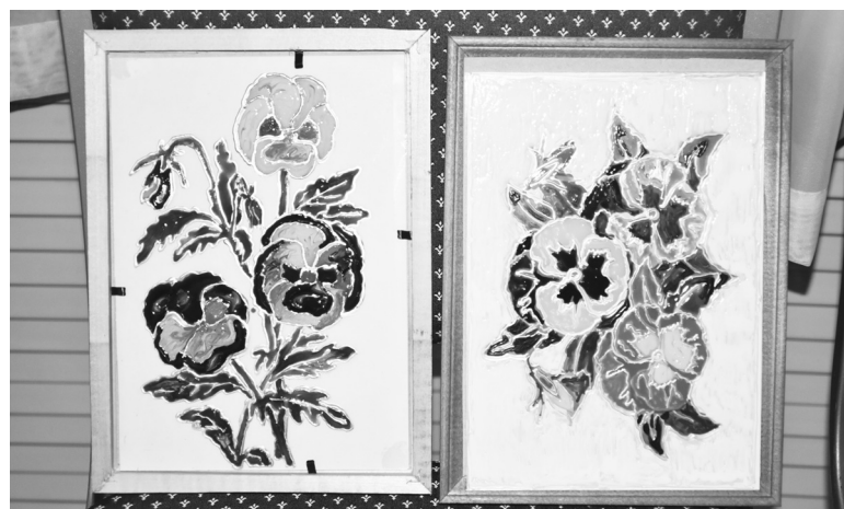
Готовые картины после мастер-классов украсили выставку в зале

мест, облюбованных промысловиками. В Истошино живет с начала 2010 года.