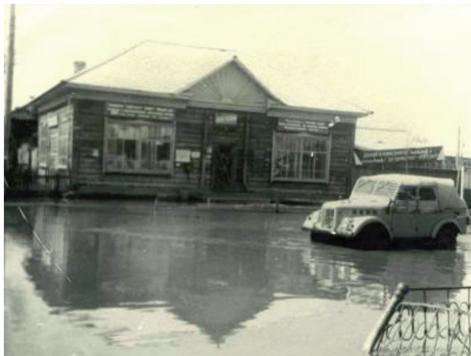
Магазин «Тюменцевой» работал даже в период наводнения 1970 года.