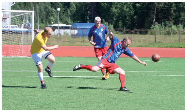
Футбольная ласточка участника команды Центрального предприятия МЭС Западной Сибири.

14 и 15 июля 2018 года в селе Уват (Тюменская область) состоялась Летняя Спартакиада филиала ПАО «ФСК ЕЭС» - МЭС Западной Сибири.