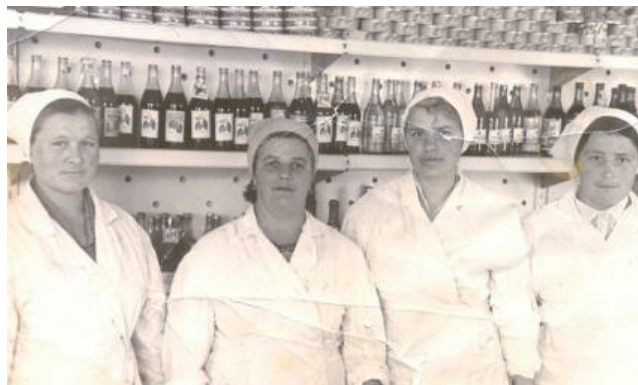
Коллектив продовольственного магазина № 1.

- В питейных заведениях России до девяностых годов девятнадцатого века приобрести водку на вынос можно было только целым ведром. Минимальный объем составлял три литра.