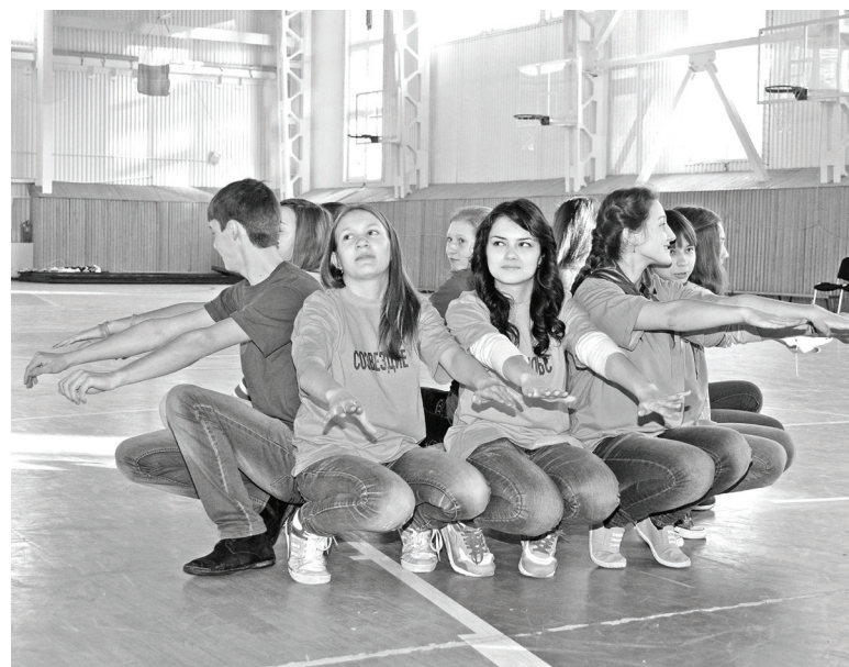
На площадке «Мастер-класс». Каждый отряд подошёл к заданию творчески.