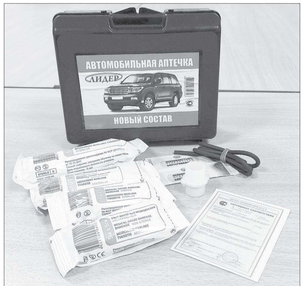
Старым аптечным комплектом можно пользоваться до окончания срока годности

Изменения прописаны в федеральном законе, определяющем условия, которым должны отве-