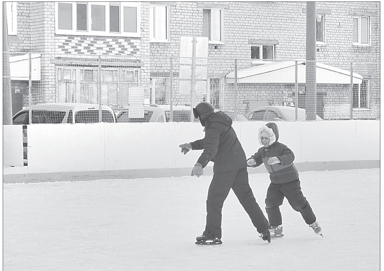
Первым в Ялуторовске залили корт во дворе дома 51 на улице Свердлова