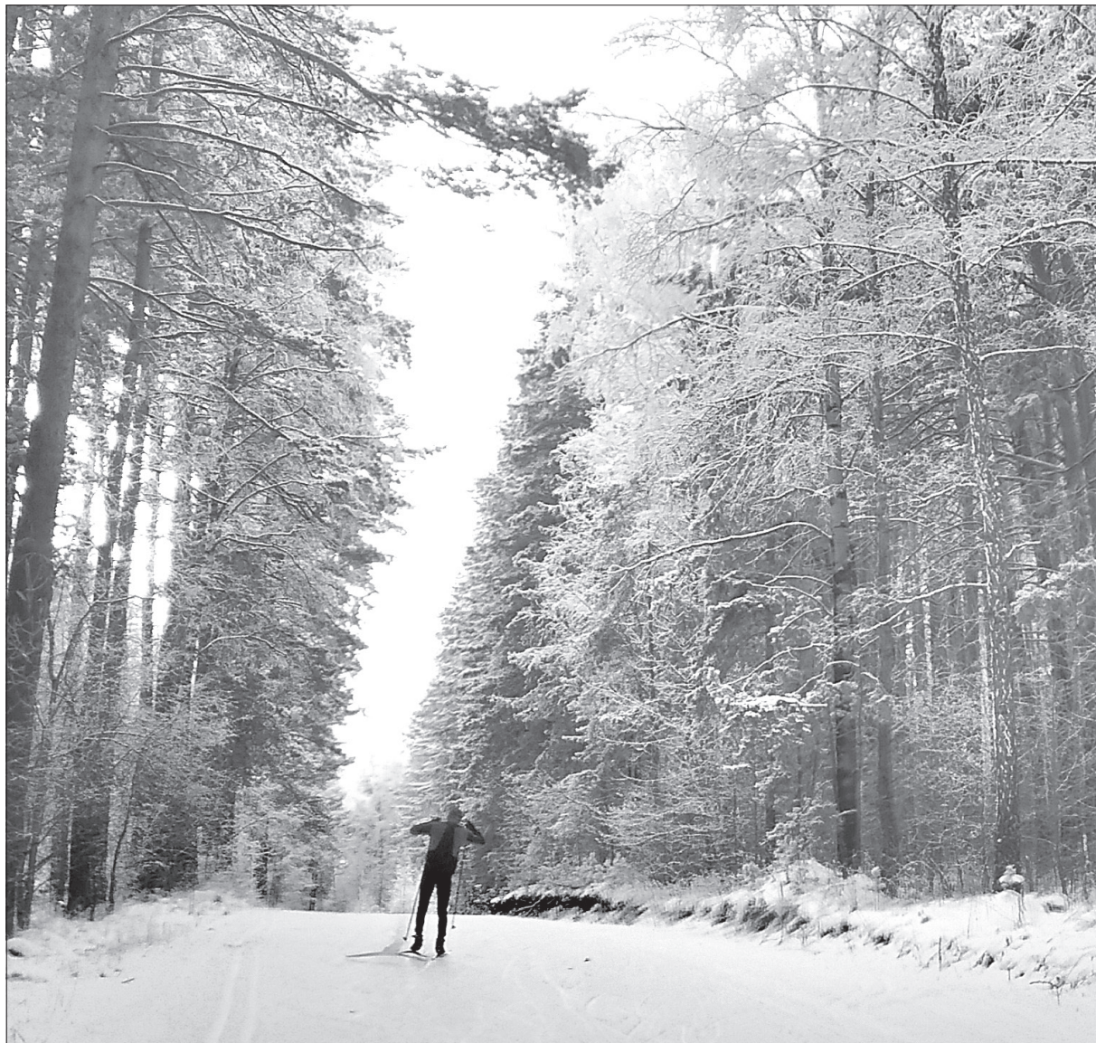
В морозной сонной тишине лишь собственное слышится дыханье