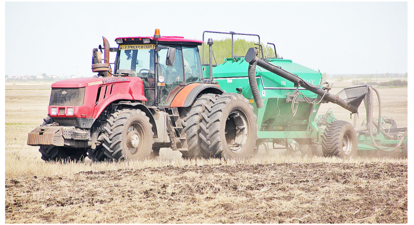
Главная задача для нового руководства СХПК имени Кирова – качественно подготовиться и провести посевную кампанию

– Животноводство на предприятии пока остаётся, люди работают в штатном режиме. Чтобы разорваться в ситуации нам необходимо провести ревизию всей отрасли. Мы не можем себе позволить работать с убытком. Первоначально задача состоит в том, чтобы заменить низкопродуктивных коров на высокоудойных и обеспечить отрасль качественными кормами. Из сочных кормов у нас делаем на заготовку сенажа из однолетних трав. Для возделывания кукурузы и люцерны нужна хорошо подготовленная почва и специальный набор техники. Возможно, в будущем будут рассмотрены и эти варианты. Кроме того, для