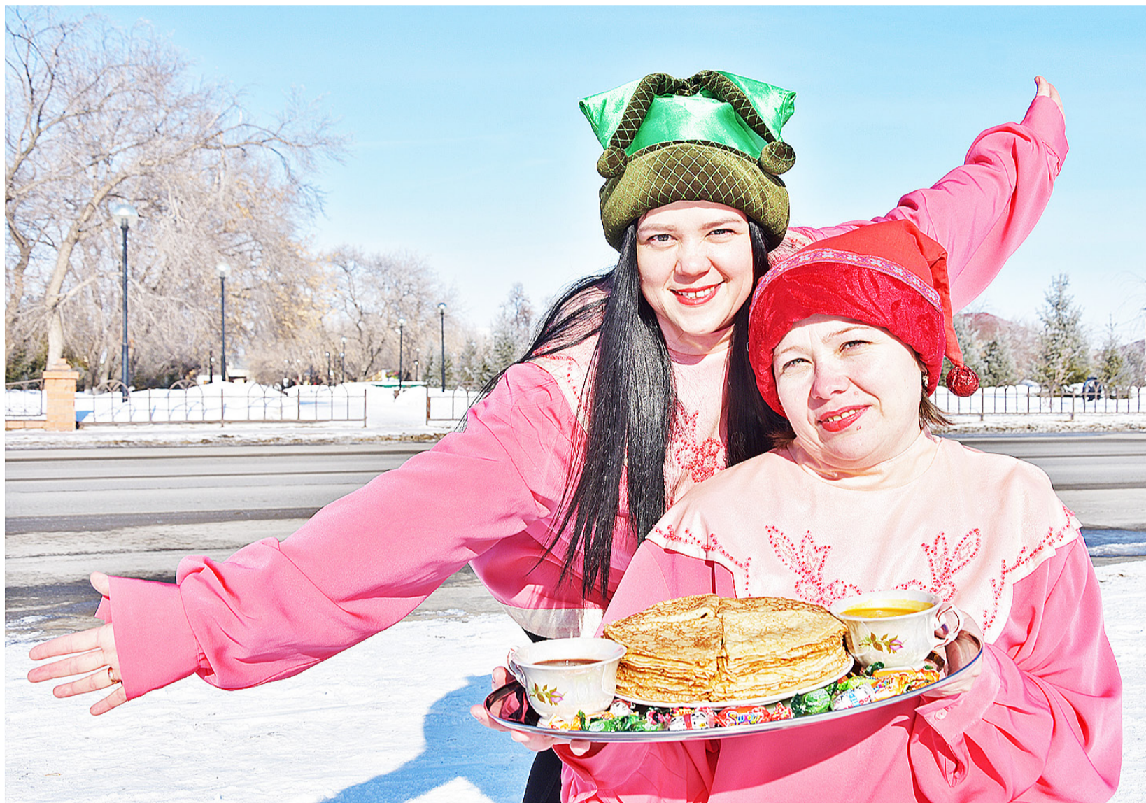
С первого дня Масленной недели хозяйки принимались печь блины

С 28 февраля по 6 марта православные отмечают весёлую Масленицу