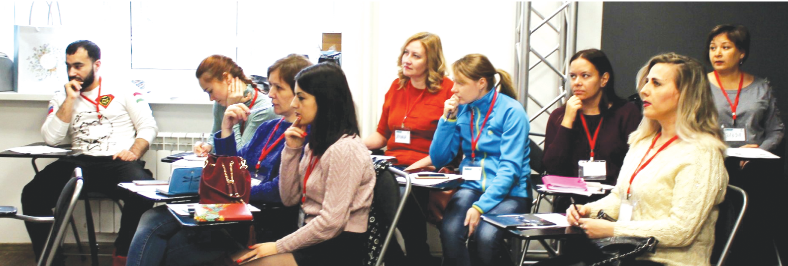
Со вниманием – к социальному обустройству

(Другие подробности обучения в ШСП «PROГород» читайте в следующих номерах газеты.)