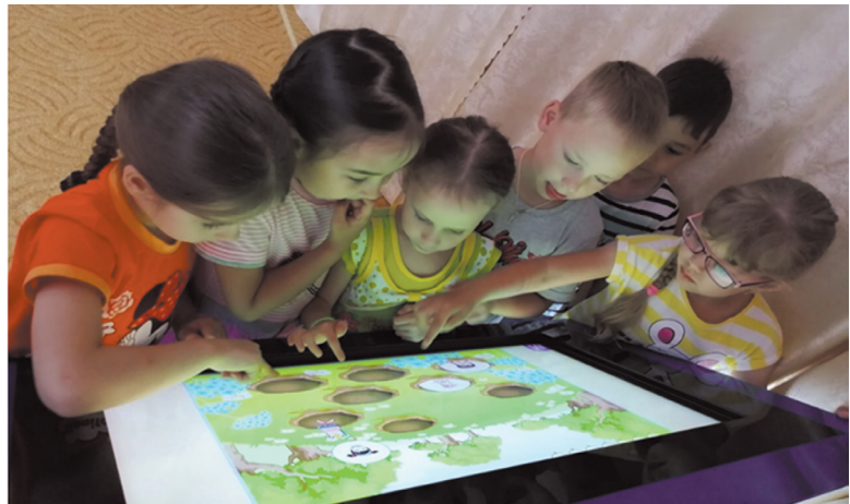
Мы растём, развиваемся

– Уже при входе на территорию детского сада сразу бросается в глаза ухоженность, и во всём чувствуется забота о подрастающем поко-