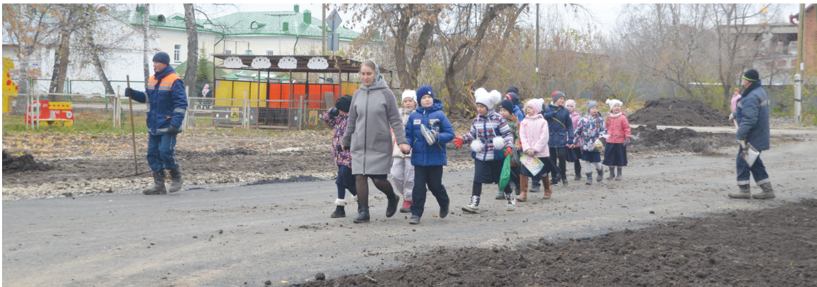
На обед дружным строем