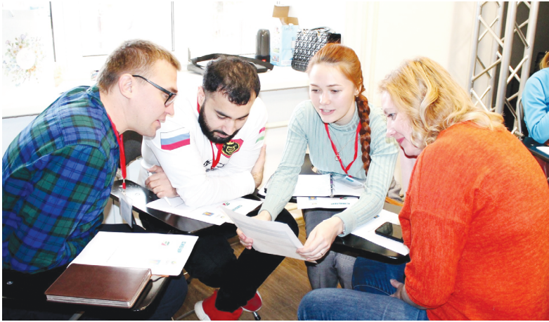
Изучая общественные проекты

Именно с этой целью для решения многочисленных социальных проблем общества государство сегодня делает большую ставку на социальный бизнес, активно поддерживая его с помощью льготных кредитных ставок, бюджетных вливаний и других преференций. Даже издан закон