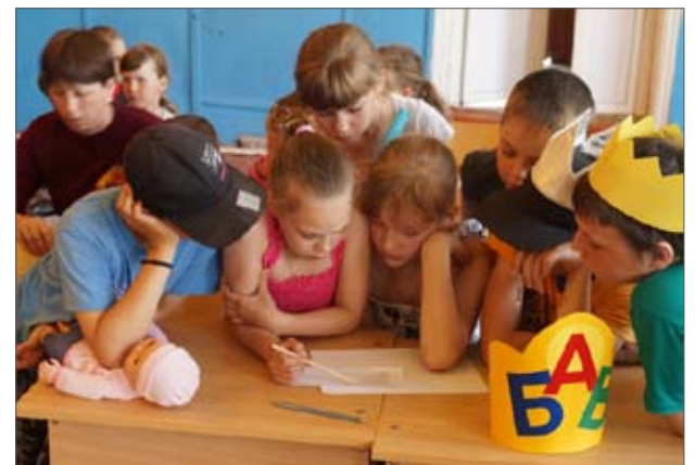
В раздумьях над шарадами

Пришло время тихого часа, и уставшие маленькие жители планеты разбрелись по спальным комнатам. А ребята постарше организовали в это время акцию «Мы против сквернословия!». К сожалению, оно становится болезнью.