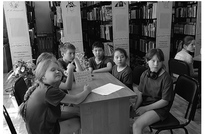
В межлагерной интеллектуальной схватке ребята решают непростые задачи