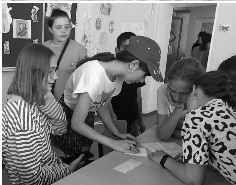
На снимках: моменты жизни ЛДП

шее, что произошло с ними в течение смены. Программу к закрытию лагерной смены подготовили насыщенную. Это и импровизированный концерт, и интересные тематические игры. Провели итоговое анкетирование. Приятно было слышать, что за время пребывания в лагере дети нашли новых друзей, узнали много новых игр, по-