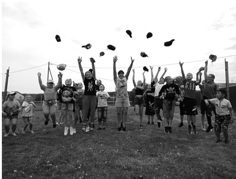
Второй сезон ЛДП оставил у детей яркие впечатления

Программа лагеря дневного пребывания была насыщена разными спортивно-познавательными развивающими мероприятиями и играми, которые способствовали активному отдыху, а главное, формировали творческие способности детей. Мы с огромным интересом принимали участие в игровых программах, в коллективных делах лагеря. А какие замечательные мероприятия прошли в нашем лагере! Это