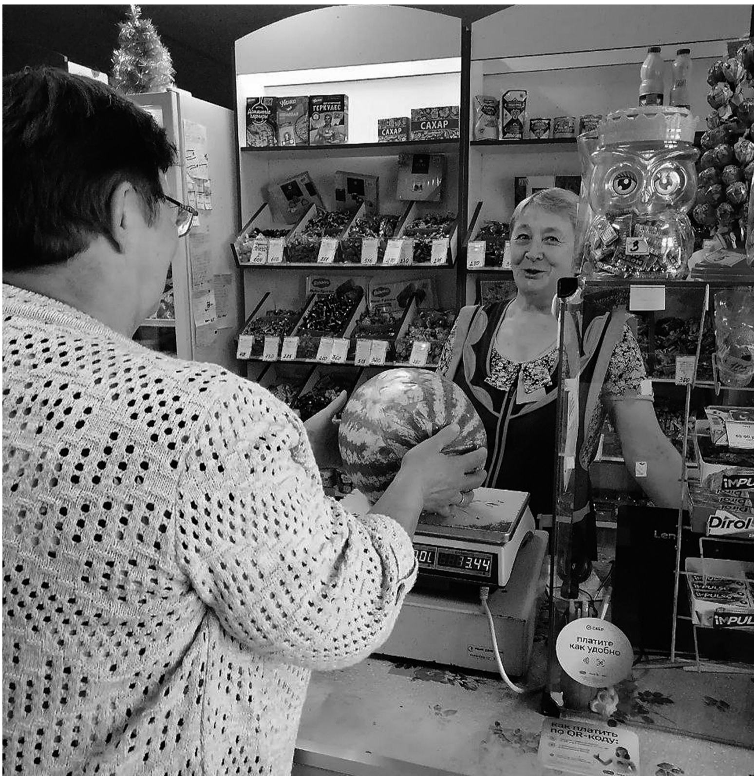
Ассортимент в магазине в селе Знаменщиково весьма разнообразен