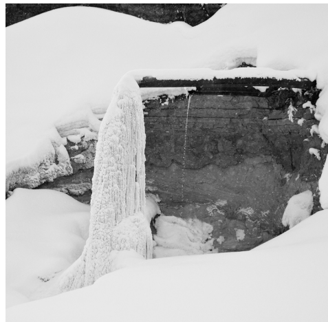
Фото на реке сделано 24 января. Из этих труб вода с очистных сооружений сбрасывается в Тавду.