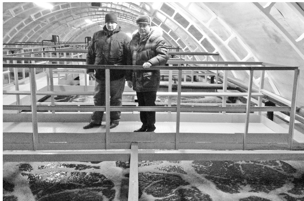
По ногам – чёрная бездна, а в последнем резервуаре вода станет чистой – невероятные превращения происходят на КОС.