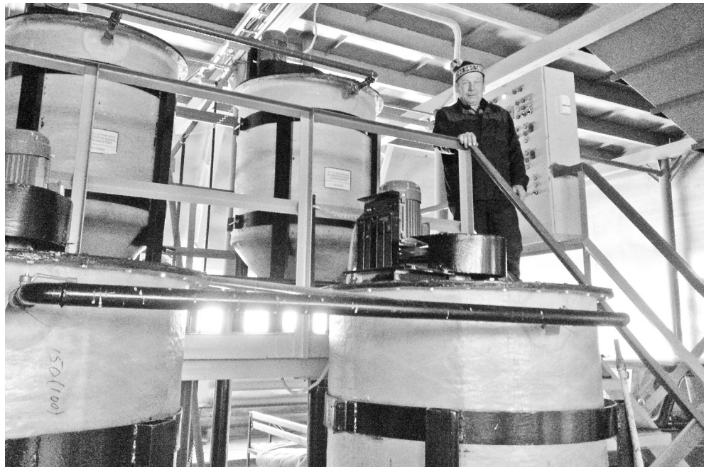
В этом блоке находятся баки с реагентами, здесь ил выпадает в осадок.