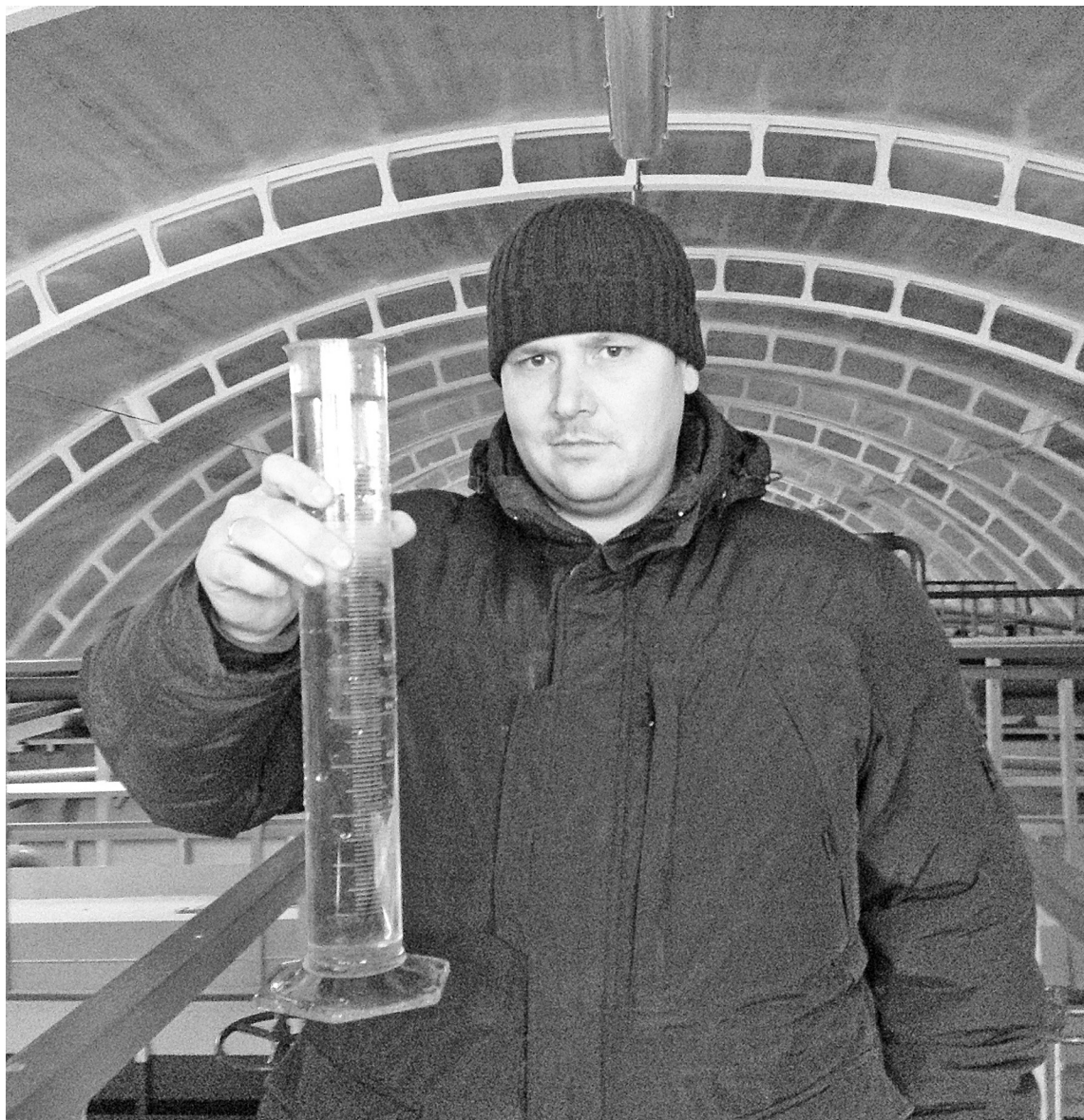
Трудно было поверить, что нечистоты после очистки могут иметь такой результат. Пивнуть хотелось!

– Сюда поступают нечистоты, именно здесь работают специальные бактерии, они