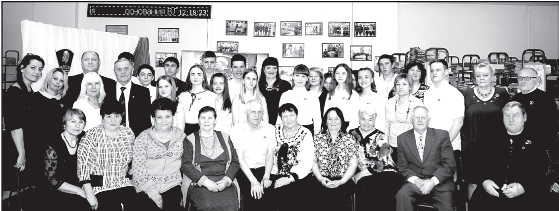
Участники форума «Юность комсомольская моя»