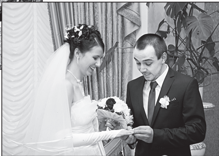
Свадьба сына: 12.12.12

– А как иначе, если люди в селе – как одна большая семья, – аргумент действительно убедительный. – По частным вызовам ездила на велосипеде. Во время массовой обработки, дважды в год – осенью и весной, помогала юргинским ветеринарам прививать крупный рогатый скот.