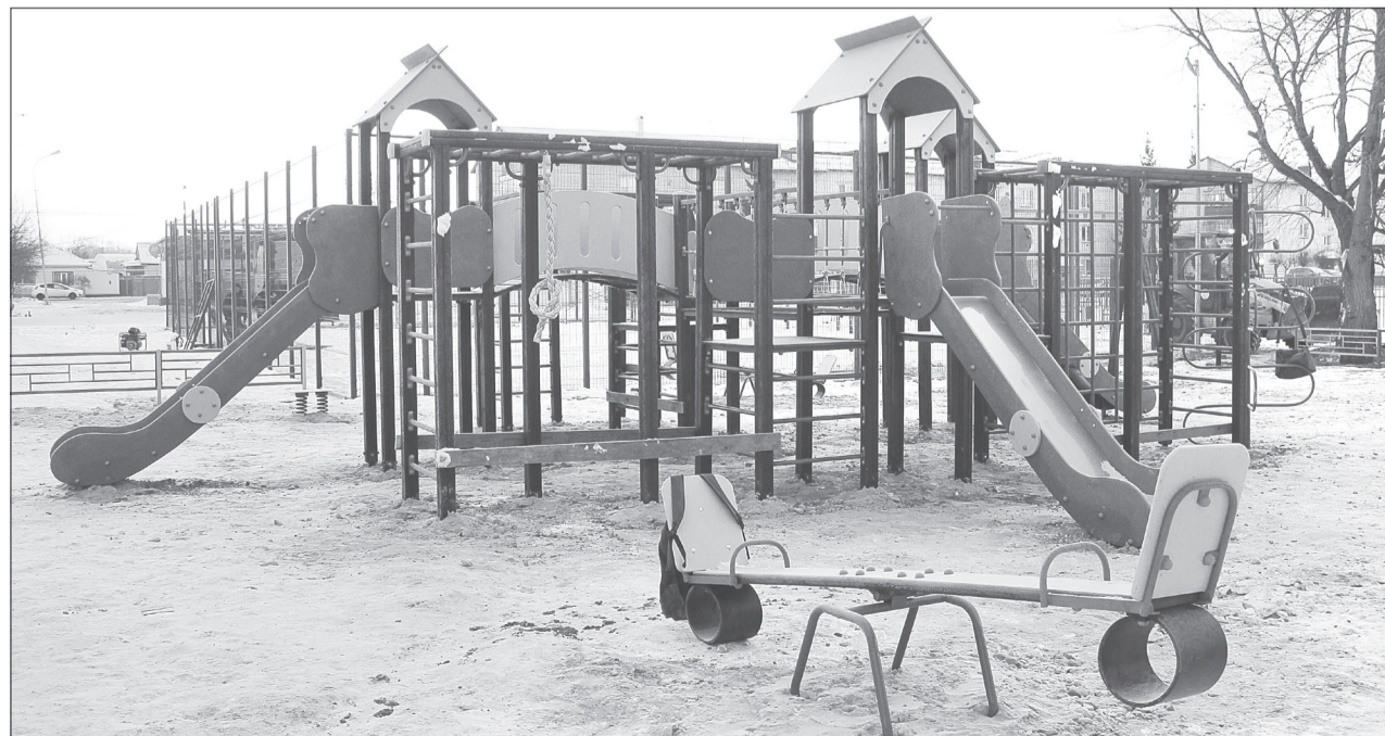
Игровая и спортивные площадки во дворе дома 94 по ул. Северной.