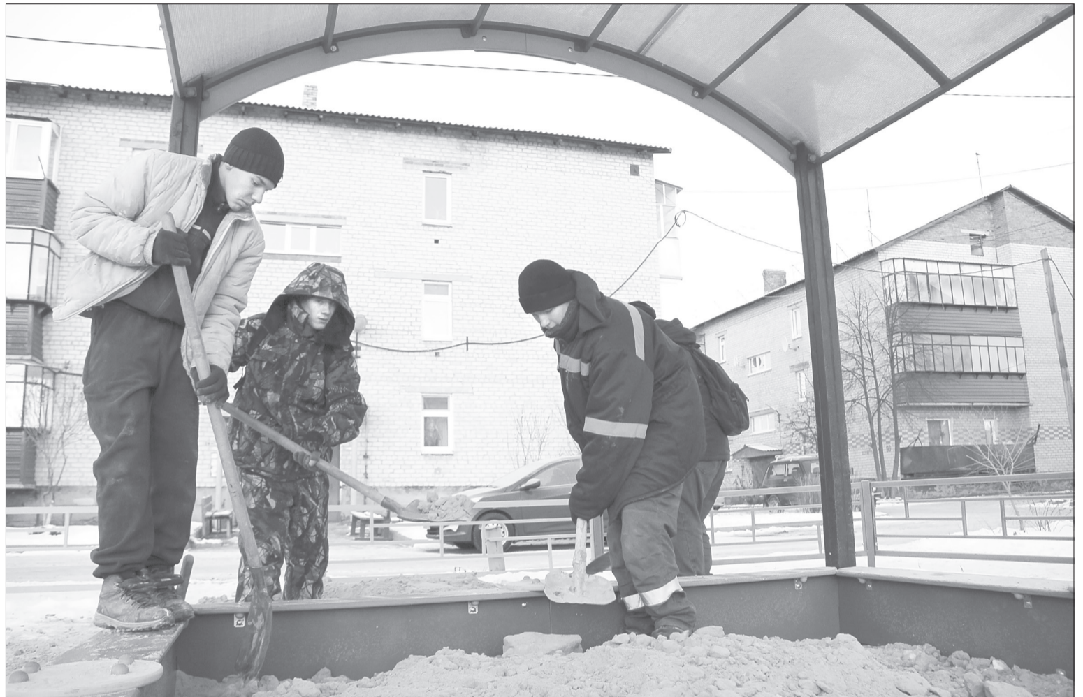
Вот и песочница готова! Места в ней хватит всем малышам, а от солнца и дождя их защитит крыша из поликарбоната

Стоимость на полугодие: в редакции «ЯЖ» - 480 руб., на «Почте России» - 798 руб. 42 коп.