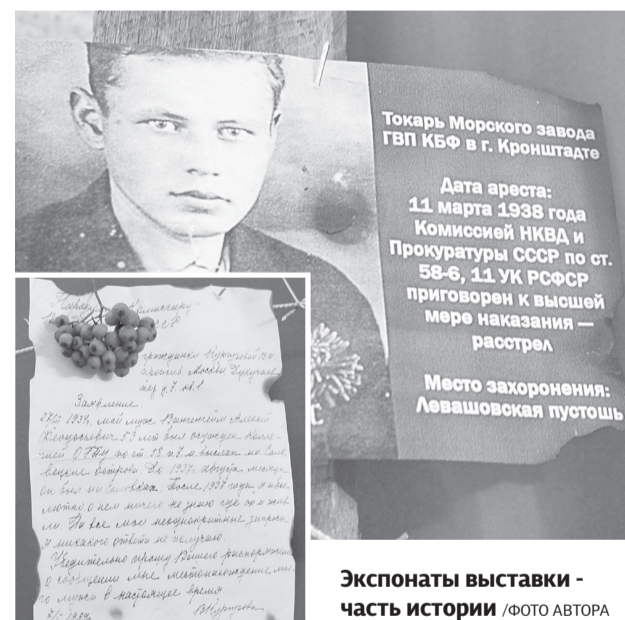
Экспонаты выставки - часть истории

Отец Дионисий Заводоуковского Свято-Георгиевского храма также проникновенно говорил о том, что свобода – главная ценность челове-