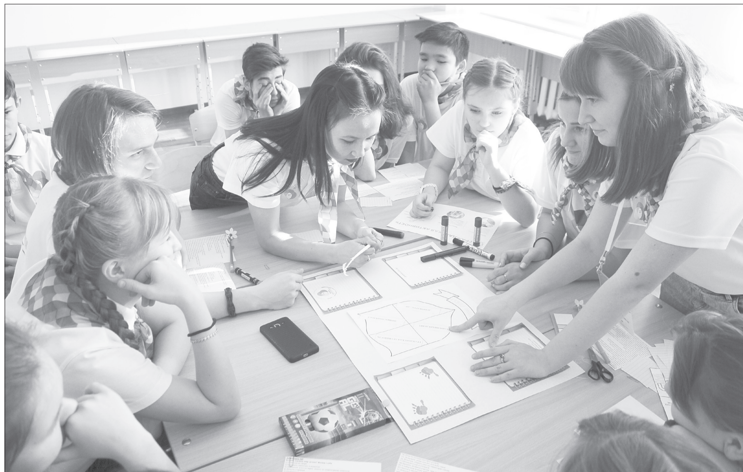
На площадке гражданской активности ребята рассуждали о волонтерстве, добрых делах и личностном росте