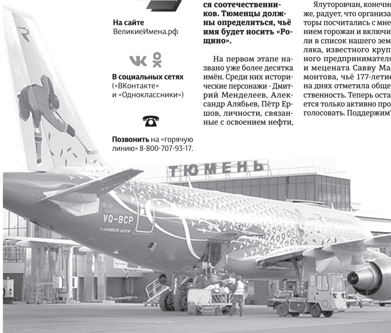
В мае этого года аэропорту «Рощино» исполнилось 50 лет

Ялуторовчан, конечно же, радует, что организаторы посчитались с мнением горожан и включили в список нашего земляка, известного крупного предпринимателя и мецената Савву Мамонтова, чьё 177-летие на днях отметила общественность. Теперь остается только активно проголосовать. Поддержим?