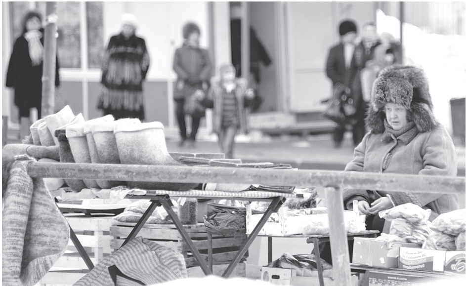
Скоро бабушки обретут более комфортные места

И всё же, несмотря на все сложности и непреклонность самопальных негодяев, городская администрация вновь активизирует работу по упорядочению стихийной торговли на территории То-