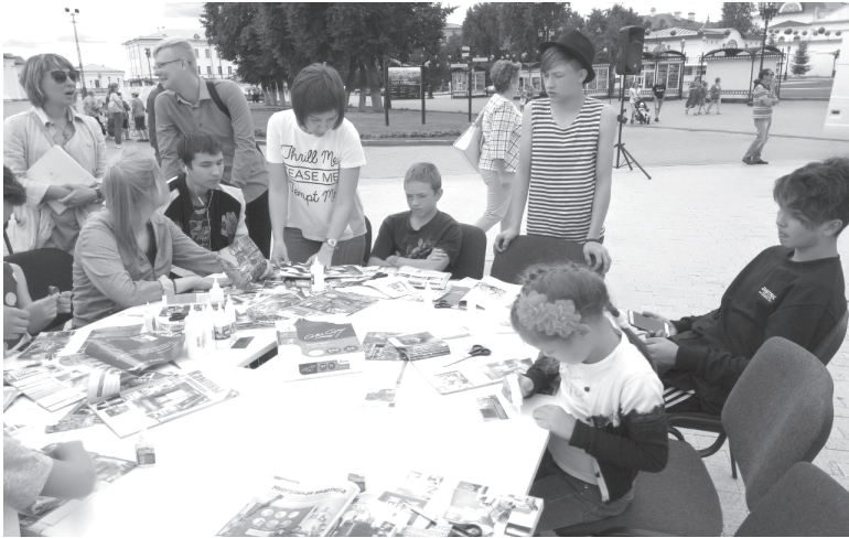
Работа приносит результат

В проект вовлечено более 80 подростков из 13 районов Тюменской области, в том числе и 15 подростков из Тобольска. Для них организована работа не-