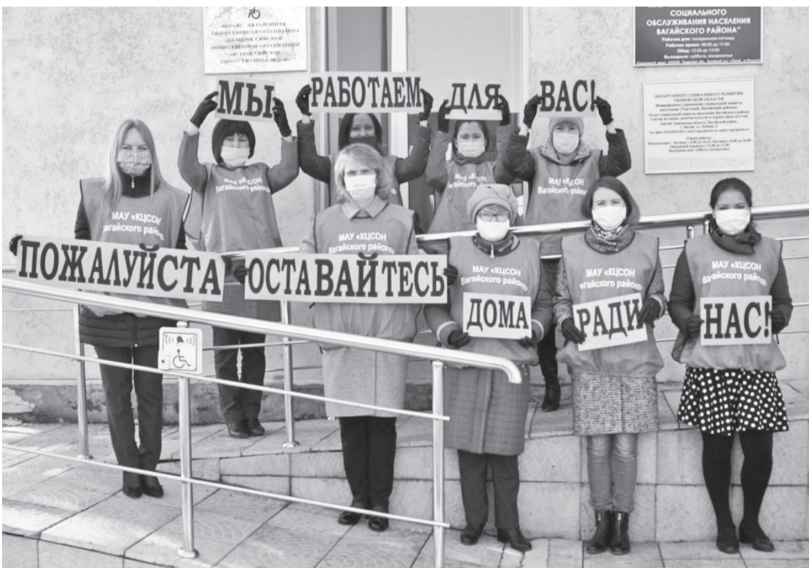
Флешмоб сотрудников КЦСОН Вагайского района