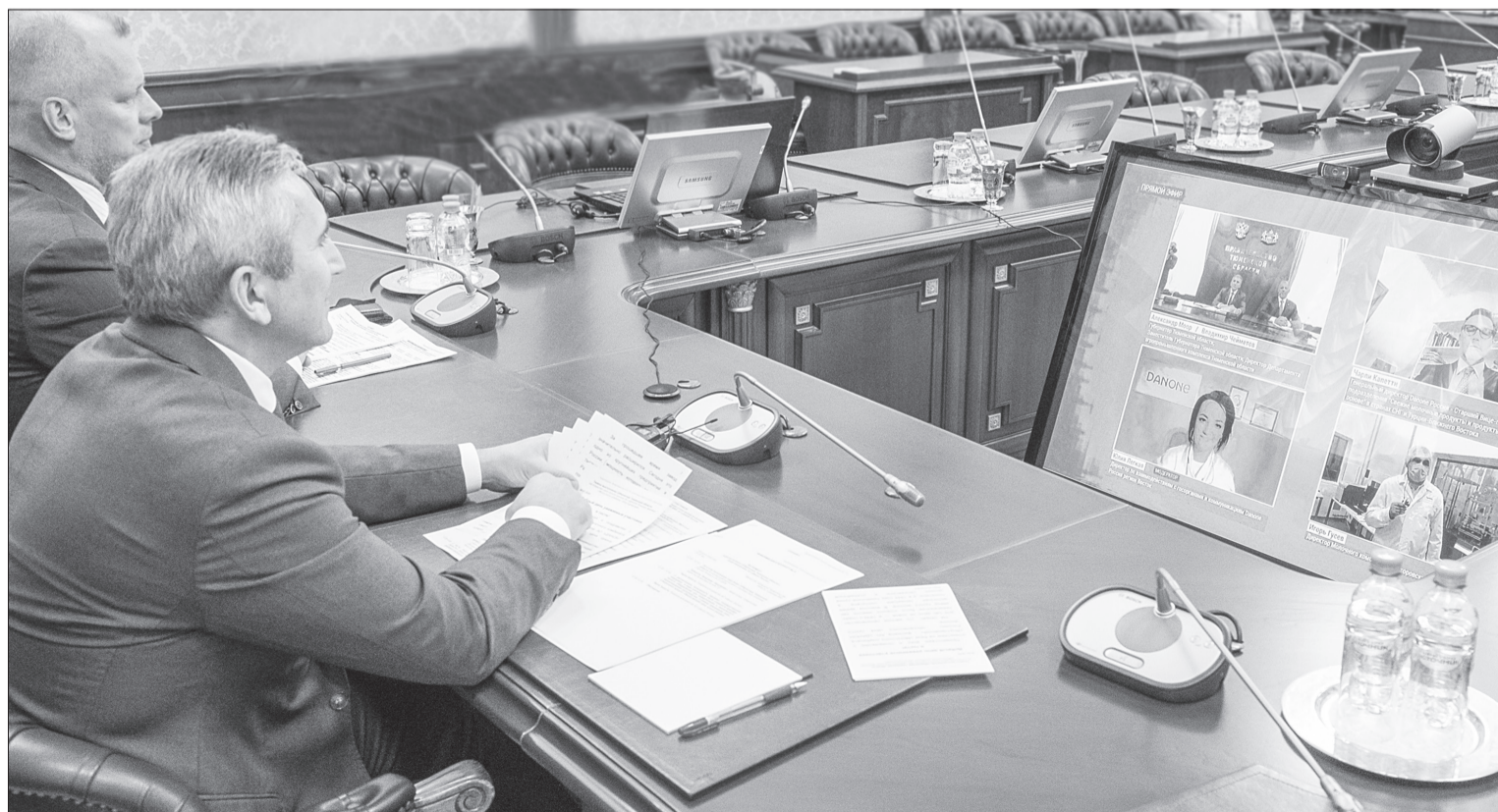
В пуске нового цеха молочного комбината принял участие губернатор Александр Моор, нажав виртуальную кнопку «старт», включившую линию

В начале 2000-х, когда комбинат выпускал линейку из сотни наименований продукции, цех сухого молока закрыли. Оборудование устарело, да и продукт не был так востребован. Но современные реалии изменили ситуацию. Решение возродить производство было принято несколько лет назад, и компании это удалось.