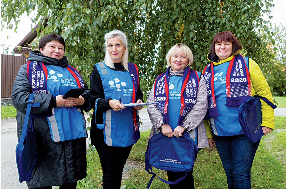
■ Штат переписчиков в полном снаряжении

Помещение для переписной кампании на труднодоступных селениях подобраны, совместно с главами сельских поселений согласован штат переписчиков, обсуждается, каким видом