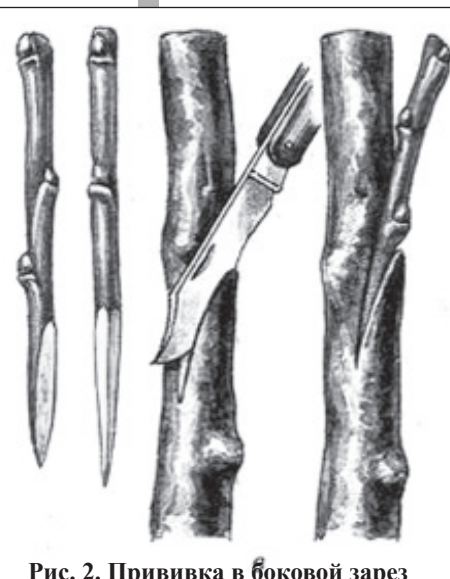
Рис. 2. Прививка в боковой зарез