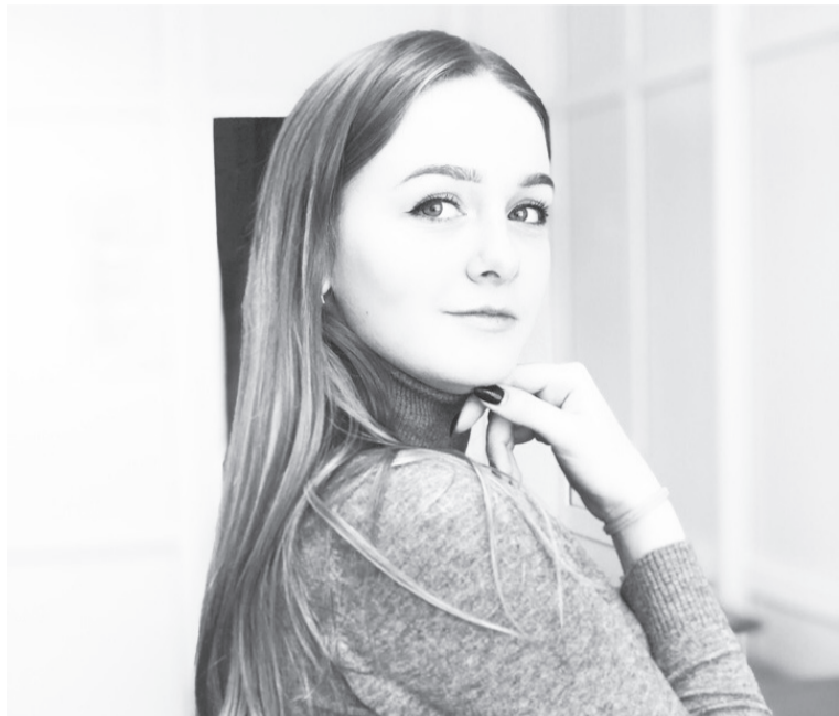
Её мечта – реализовать в своей будущей профессии.

25 января отмечается не только как День российского студенчества. В этот день в православных храмах почитают святую мученицу Татиану. А всех обладательниц этого прекрасного имени поздравляют с их днём ангела.