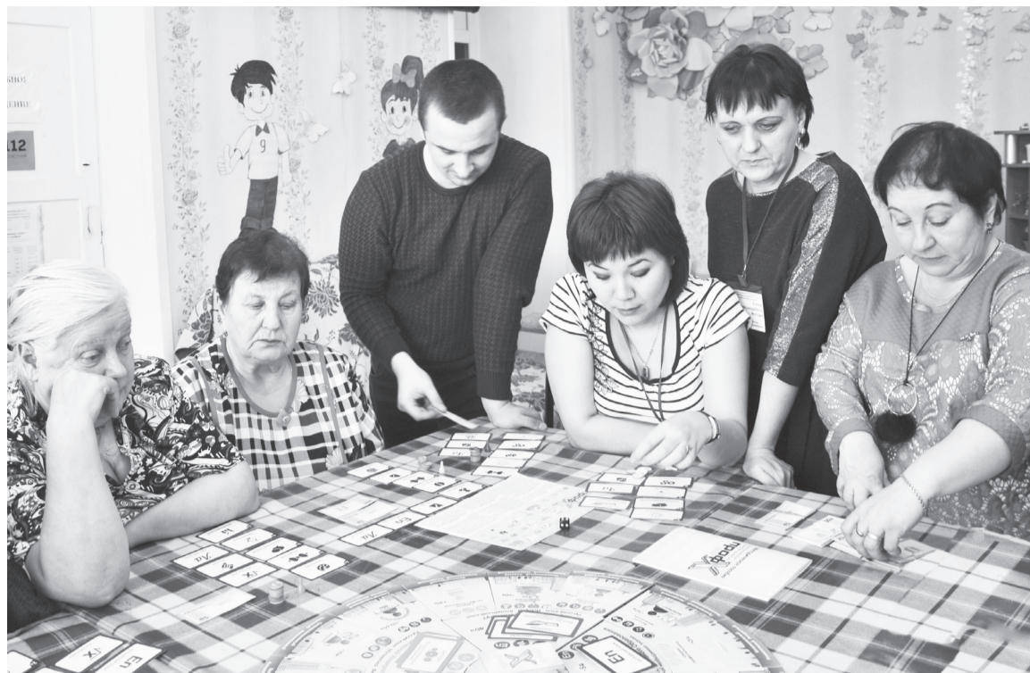
Когда увлечён, и время бежит быстро.