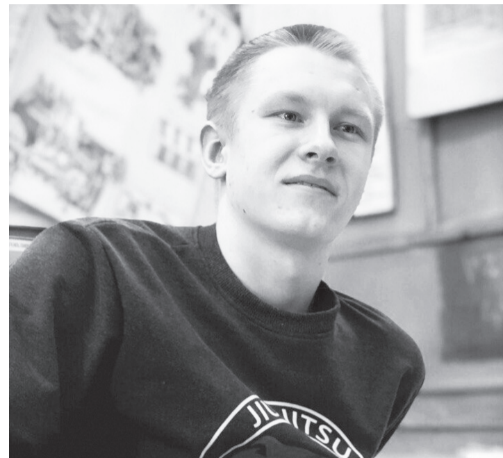
В числе любимых дисциплин – спорт.

Марина МЕДВЕДЕВА.