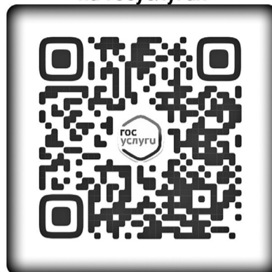
Налоговые уведомления на Госуслугах