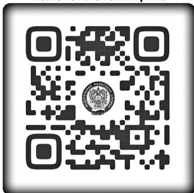
Личный кабинет налогоплательщика