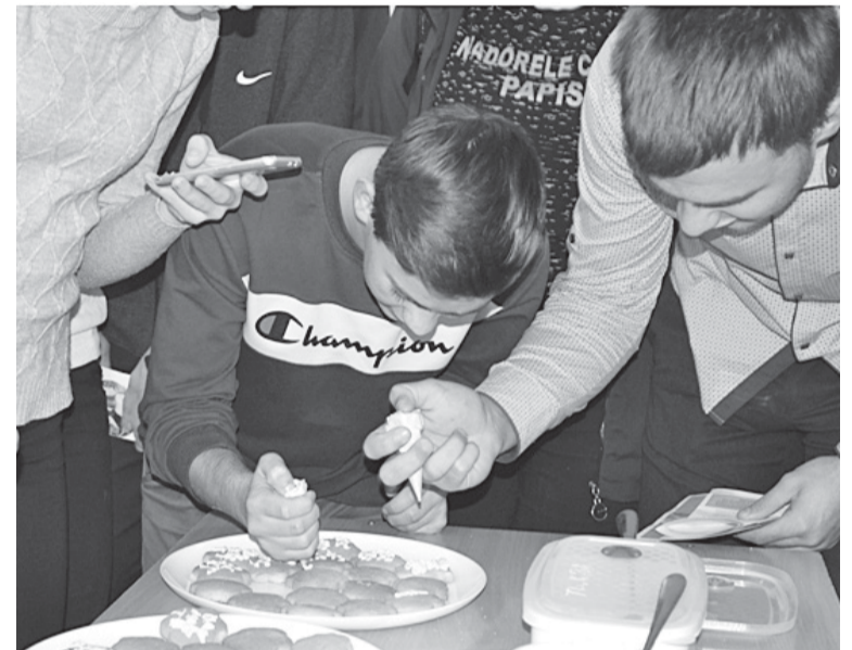
На снимке: мастер-класс по кулинарии