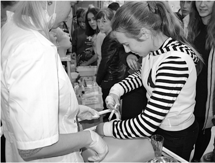
На снимке: мастер-класс по уколам внутримышечно

Мероприятие проводилось для учащихся 9–11 классов школ района с целью оз-