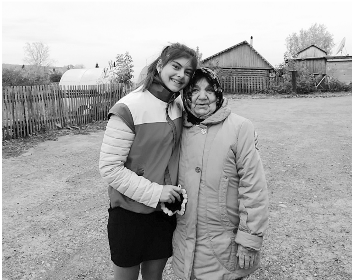
На снимке: счастливый момент в жизни двух поколений

Отрадно видеть, когда от простых человеческих объятий на лице появляется улыбка, разглаживаются морщинки, а в глазах блестят слёзы умиления. Для этого надо совсем немного: чтобы чаще рядом появлялся чуткий собеседник. Не ждите праздничной даты, позвоните или навестите своих близких, чтобы они чувствовали себя неодинокими, окутайте их своим вниманием и заботой, и тогда осень жизни действительно будет золотой!