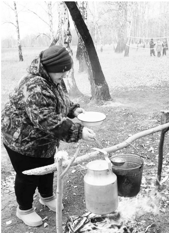
На снимке: готовится вкусная уха