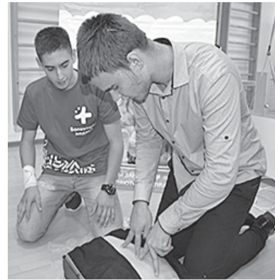
На снимке: мастер-класс по сердечно-лёгочной реанимации

Ишимский многопрофильный техникум организовал мастер-класс по украшению кремом печенья. Представители медицинского колледжа продемонстрировали, как правильно делать сердечно-лёгочную реанимацию, ставить укол в ягодичку и мерить давление (желающие могли попрактиковаться на