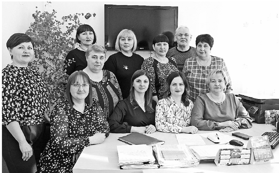
► Коллектив Викуловской администрации