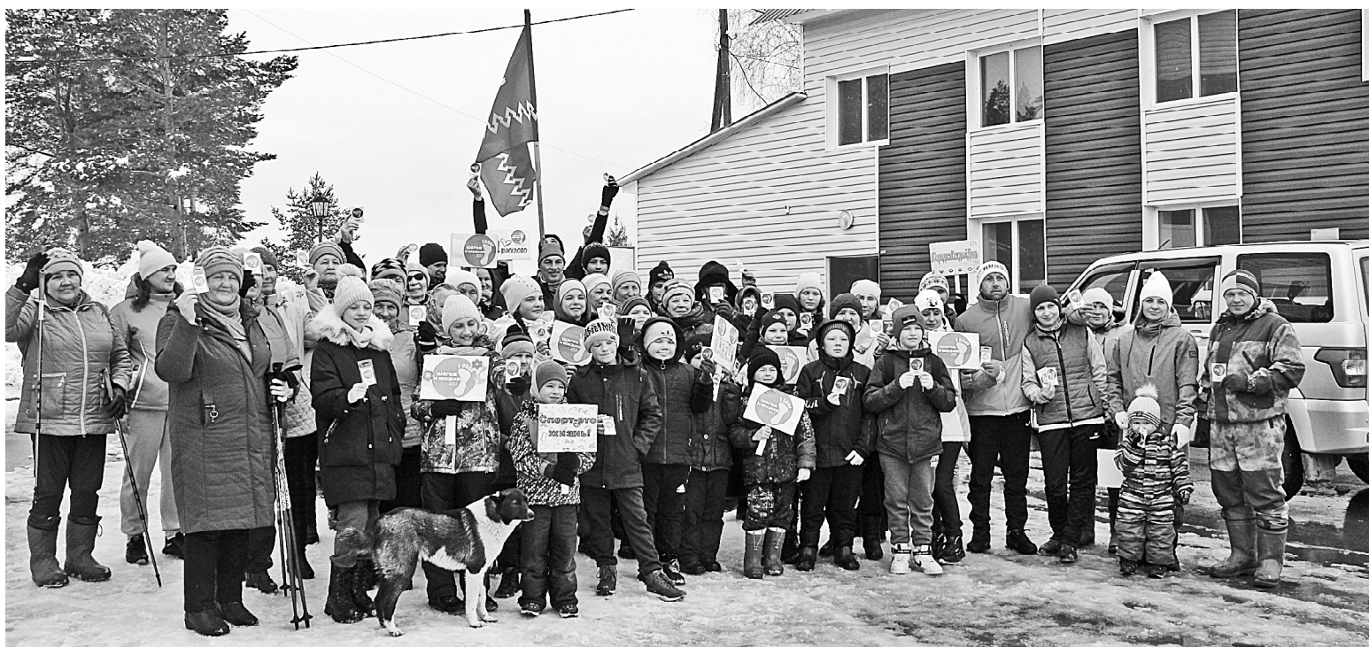
» Во время акции в Викулово

Всероссийская акция «10000 шагов к жизни», организованная Общероссийской общественной организацией «Лига наций», стартовала 3 апреля. Мероприятие прошло в рамках национального проекта «Спорт – норма жизни», главной целью которого является привлечение внимания максимального количества граждан к здоровому образу жизни, повышению физической активности. Акция приурочена ко Всемирному дню здоровья и направлена на развитие и пропаганду естественных методов оздоровления и руководствуется принципом «Наилучшее здоровье с наименьшими затратами».