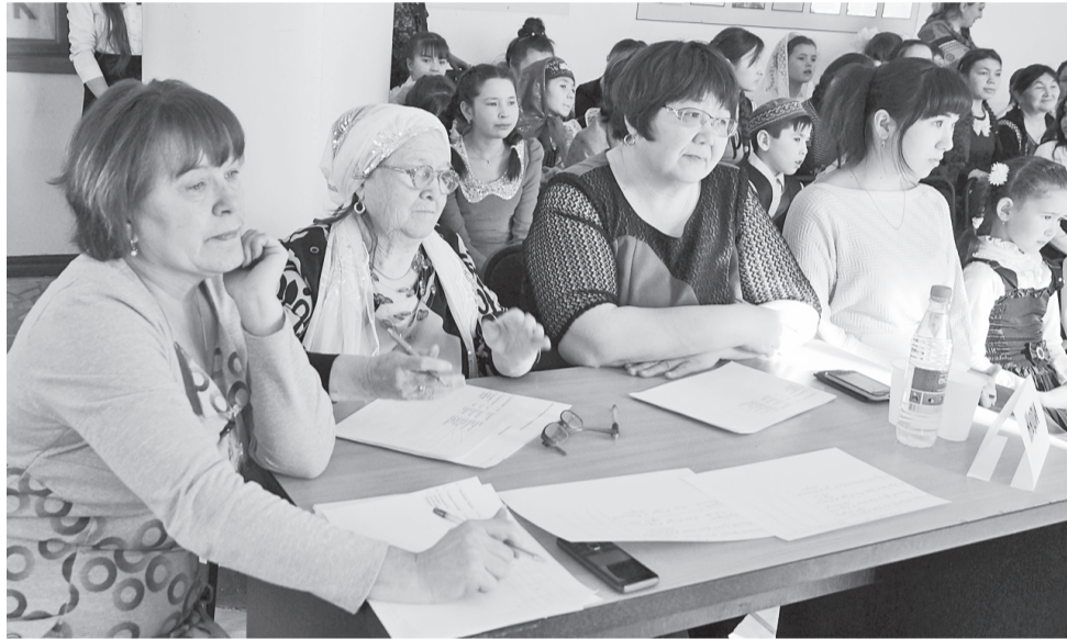
Работа жюри на конкурсе юных чтецов, посвящённом 110-летию со дня рождения Мусы Джалиля

Такие же радостные мгновения пережили жители Санниково, которые в этом году открывали Дни татарской культуры в районе, принимая гостей из всех поселений. Здесьние культработники устроили праздник «Авыл-офыклары» («Сельские горизонты»). О нём мы