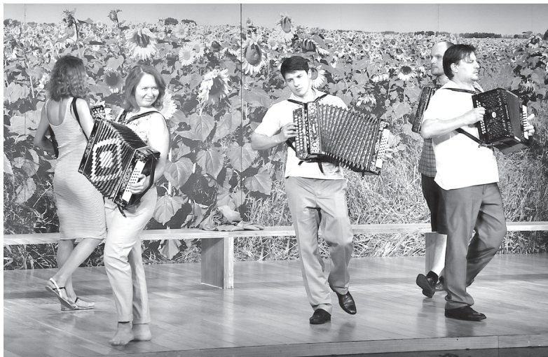
Сцена из спектакля Театра Наций

В умелых режиссёрских руках старая добрая классика получает новое наполнение. Статус «классический» – для произведений, написанных о человеческой сути. Век от века меняется ритм, ампир сменяется минимализмом, а суть человека неизменна. Трактуйте классику, наряжайте её в одежды своего века, иначе она не подействует. Для «Сатирикона» – путь испытанный. Путь, по которому тобильский зритель уже давно сделал первые шаги.