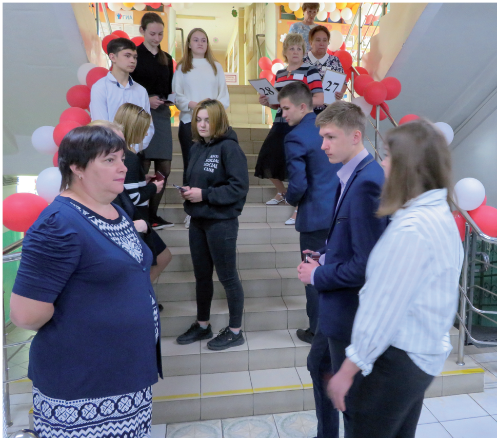
Организаторы провожают школьников в аудитории.