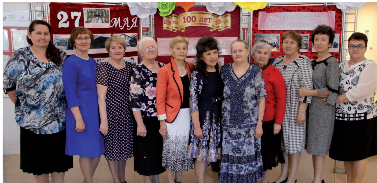
Ветераны библиотечной системы района встретились на юбилейном торжестве.