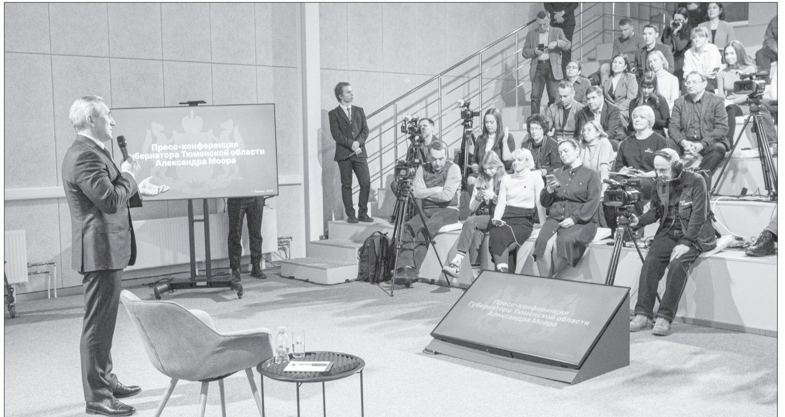
На пресс-конференции Александра Моора побывали представители 60 федеральных, региональных и районных СМИ

СПРАВКА «ЯЖ». Чтобы записаться на приём к главе города, необходимо позвонить в приёмную администрации по телефону 8 (34535) 2-02-99.