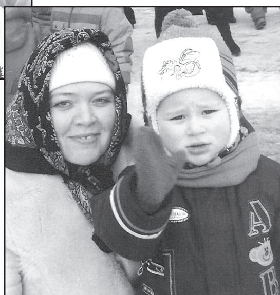
Дочь и внук

грустное. Малое и великое». Это о прозе Улицкой. Может забыть сюжет, героев, а, открыв дневник, вспомнить в деталях стиль, авторский почерк, особенности лексики. Есть заметки на полях. «Мистика», к примеру. И большой минус рядом – не понравилось. Или восклицательный знак: понравилось, значит. Очень.