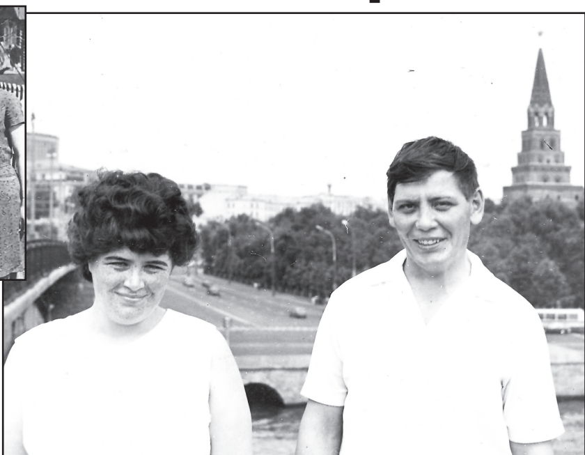
По туристической путёвке в Болгарию. Остановка в Москве