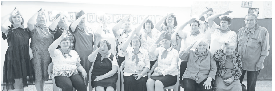
Пятковские пионеры-пенсионеры всегда готовы к свершениям и выполнению добрых дел.