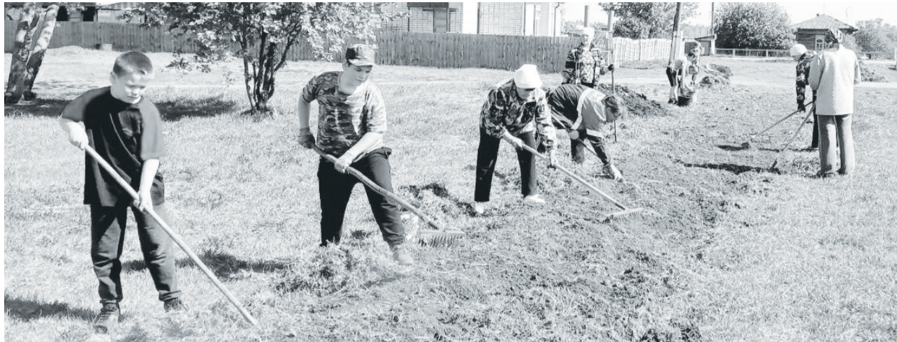
Трудовой десант активистов на общественной клумбе в центре Коркино.

Расходная часть бюджета исполнена на 100,5 процента