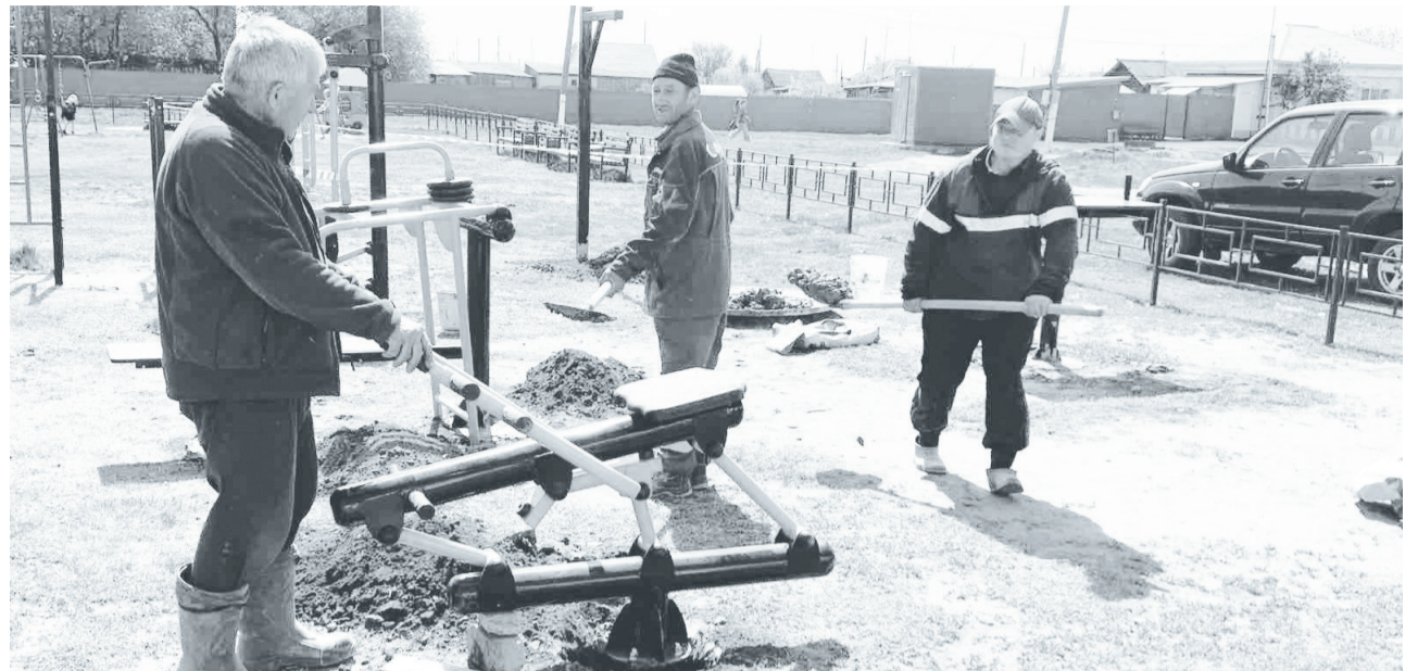
Установка уличных тренажёров в парке отдыха в с. Ингалинском.

В 2022 году администрация приняла участие в отборе получателей для оказания государственной поддержки на предоставление субсидии на реализацию мероприятий по благоустройству сельских территорий. В областном конкурсе получили грант в сумме 266 870 руб. На выделенные денежные средства приобрели пять уличных спортивных тренажё-