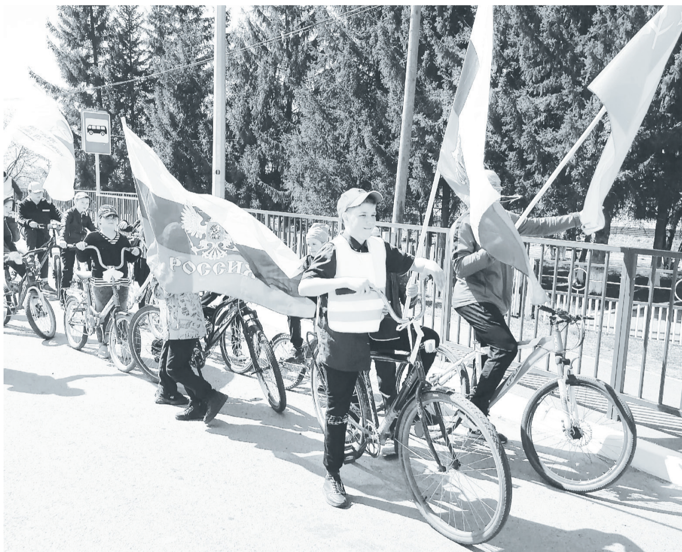
Представители молодого поколения нашего района с гордостью участвуют в патриотических мероприятиях.