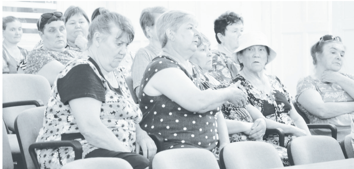
В обсуждение злободневных вопросов включились все присутствующие.