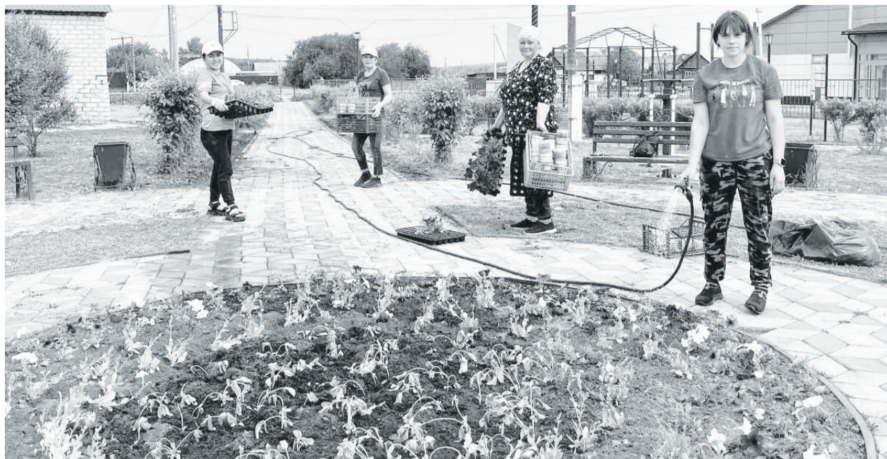
Жители Видоновского сельского поселения ухаживают за цветами в клумбах.

На территории поселения зарегистрировано 28 индивидуальных предпринимателей (ИП), у которых организовано 48 рабочих мест, самозанятые – 35 человек. В течение года создано 8 рабочих мест (ИП Заморов И.А. – 1 рабочее место; ИП Сафаров Р.А. – 4; ЗАО «Нива-Агро» – 3). Проведены онлайн-консультации со специалистами района по развитию предпринимательства, действующим программам поддержки, возможностям кредитования, созданию интеграционных